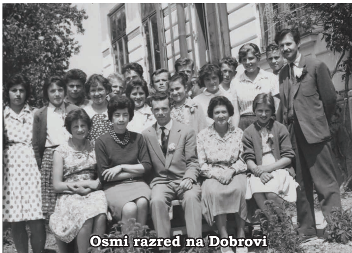
Osmi razred na Dobrovi

spomine na tista brezskrbna leta. Tudi s sošolci z učiteljišča se srečamo, če je le mogoče. Praznovali smo že 50-letnico mature. Kam čas beži!