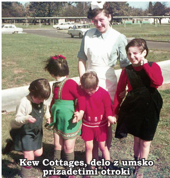
Kew Cottages, delo z umsko prizadetimi otroki

Kmalu po prihodu v Melbourne sem se vključila v slovensko skupnost v cerkveni Slomškovi šoli, kjer sem pomagala pri učenju slovenskih otrok.