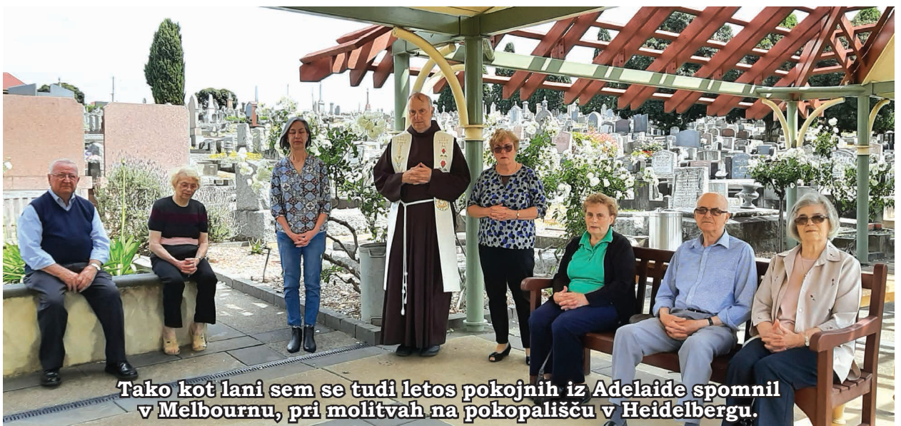
Tako kot lani sem se tudi letos pokojnih iz Adelaido spomnil v Melbournu, pri molitvah na pokopališču v Heidelbergu.

Videti je, da se v Avstraliji pandemija umirja, medtem ko so ponekod po svetu še vedno krizne razmere, med drugim tudi v Sloveniji. Verjetno gre to pripisati visokemu odstotku cepljenih, kar bo končno tudi meni pomagalo, da bom lahko redno prihajal v Adelaido. V zadnjih dveh letih sem prihajal, kolikor sem mogel, trikrat po dva tedna sem preživel v domači