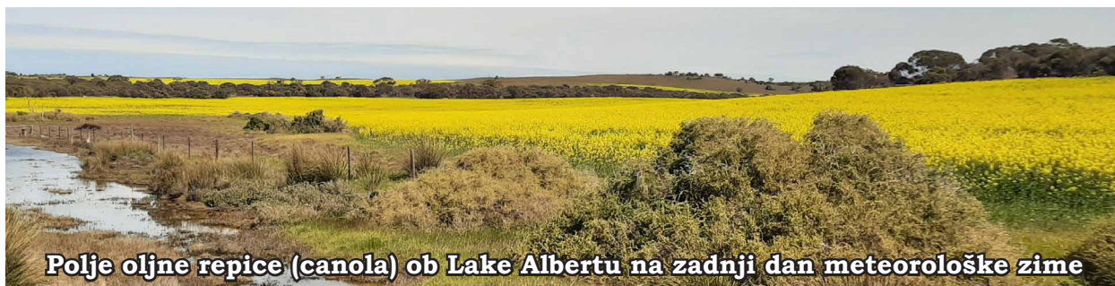
Polje oljne repice (canola) ob Lake Albertu na zadnji dan meteorološke zime

karanteni in bil kakih petnajstkrat testiran. Zato se tudi tukaj zahvalim vsem, ki ste se cepili, ter pozivam in prosim tiste, ki se še niste, da to storite. To nam nalaga ljubezen do bližnjega in odgovornost do svojega lastnega življenja in zdravja. Papež to vedno znova poudarja. Kdor zaradi neutemeljenega vzroka ne sprejme cepiva, greši proti svetosti življenja.