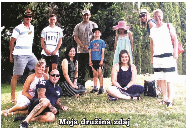
Moja družina zdaj

Ni pomembno, kje na svetu smo, za vse velja pregovor iz slovenske ljudske zakladnice: Majhno je človekovo srce, a neizmerne so njegove želje. Podajmo si roke z iskrenimi, toplimi željami in nesebično ljubeznijo, kajti nobeno drevo ne more živeti brez korenin, in človek ne more živeti brez drugih ljudi. Vsi živimo pod istim nebom. Ostanimo dobri, prijazni in spoštujmo drug drugega v tem lepem svetu, kjer domujejo veselje, vera, poštenje, sreča in zaupanje.