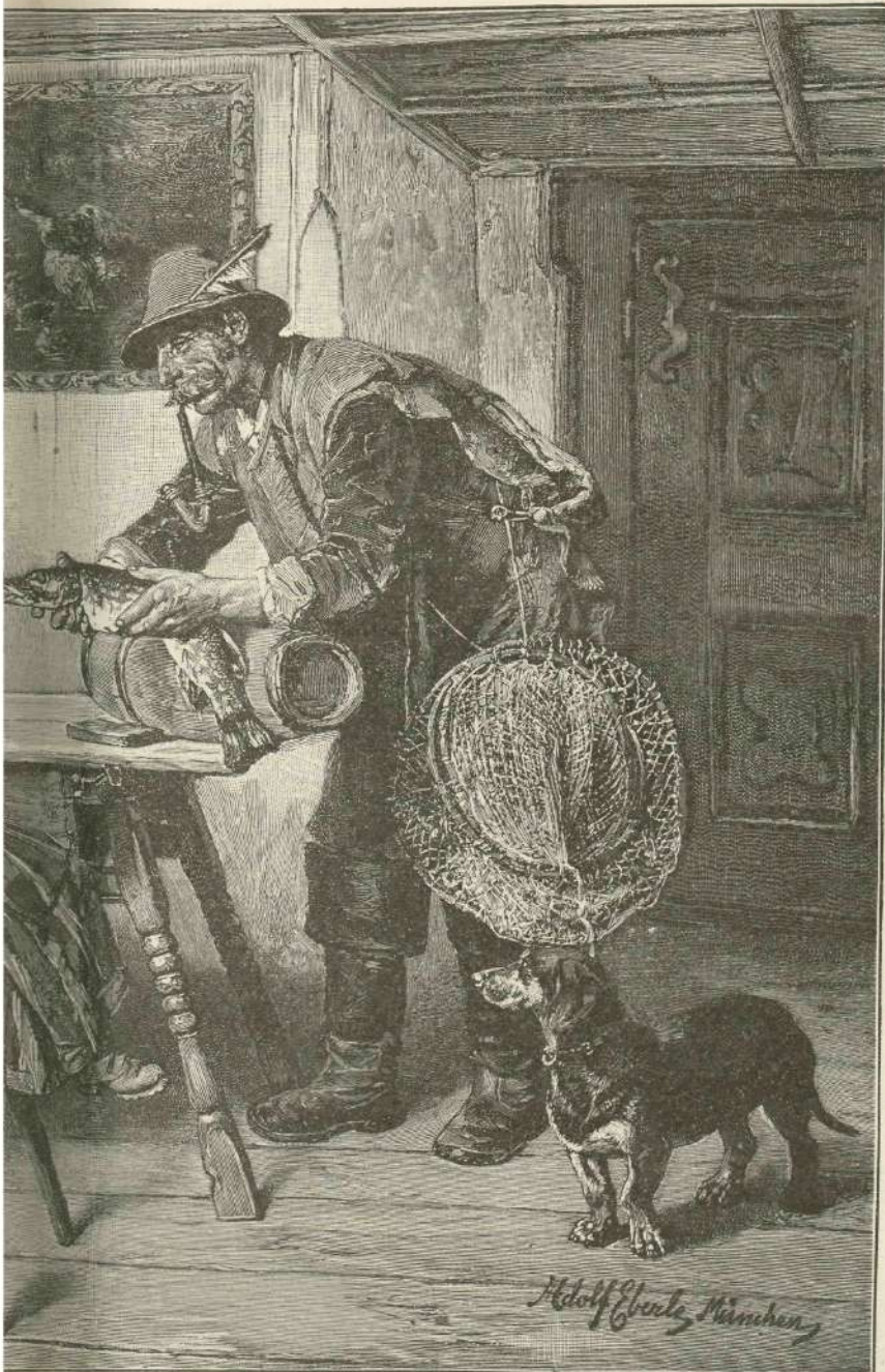
Slikal Ad. Eberle.

Adelica je nagnila glavico na Julkino lice, kot jo upogne rahel cvet, katerega zmoči prvič hudurna ploha. Vzdihnila je: „Oh, kako sem nesrečna!“ Prvič je tako vzdihnila v življenju, prvič začutila v življenju tisto nesoglasje v