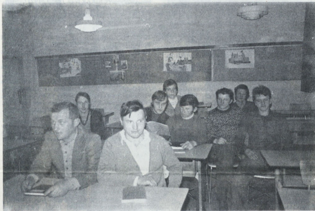
ZGORAJ - Letošnji razred "učencev" za PK ključavničarje.