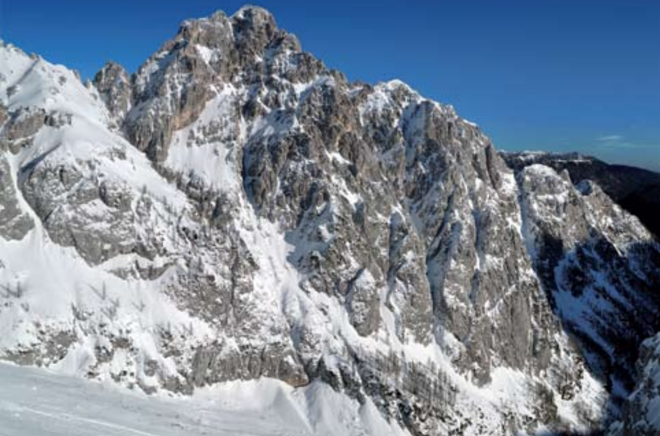
Južno ostenje Mrzle gore