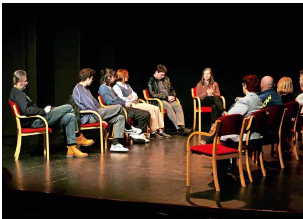
Literarni večer je potekal ob interpretiranju del različnih avtorjev.

da se položaj umetnika od Prešernovih časov do danes ni prav nič spremenil, zato verz iz njegove znamenite pesmi