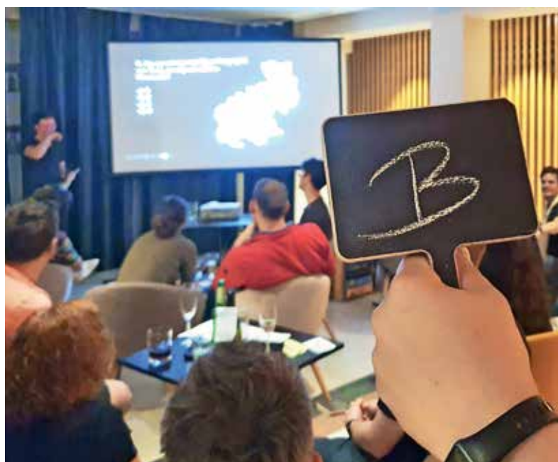
Barski kviz je priložnost za drugačen način zabavnega druženja.

Če vas barski kviz zanima, spremljajte objave na strani Bara kulture na Facebooku. Znana sta že datuma nasled-