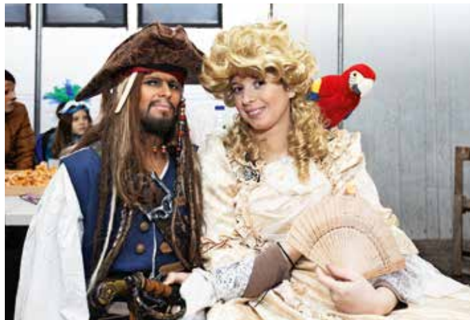
Veliko pozornosti sta vzbudila tudi pirata s Karibov.