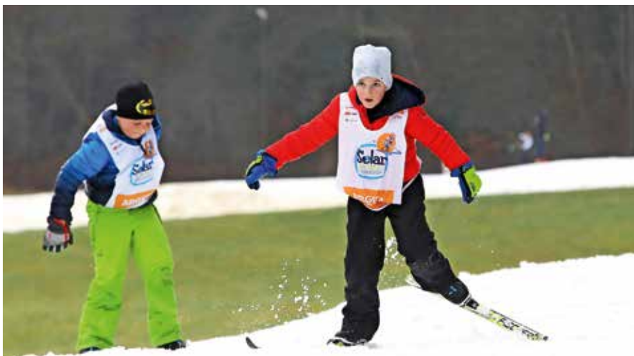
Nove izkušnje je v Bonovcu pridobilo 229 tretješolcev.

S koncem akcije Šolar na smuči se je v Bonovcu zaključila tudi letošnja obratovalna sezona, ki je uradno trajala 30 dni. »Tekachi so imeli možnost uporabe poligona 36 dni. Sezono ocenjujemo kot sicer kratko, vendar zelo intenzivno. Po zaslugi obilne pošiljke naravnega snega in posledično odlično pripravljenih smučin smo ob nekaterih koncih tedna našli tudi po več kot 500 tekačev dnevno. Ocenjujemo, da je preške smučine v minuli sezoni obiskalo skupno več kot 6000 tekačev. Med obiskovalci so prevladovali rekreativni tekači vseh generacij, tekmovalci ter člani 13 športnih društev in podjetij iz osrednjeslovenske regije. Na poligonu je bilo izvedenih sedem tečajev teka na smučeh z 42 tečajniki, 11 športnih dni z medvoškimi, ljubljanskimi, kranjskimi in škofje-loškimi osnovnimi šolami, eno državno pokalno tekmovanje v nordijski kombinaciji ter petdnevna vseslovenska akcija Šolar na smuči,« je pojasnila Ines Iskra.