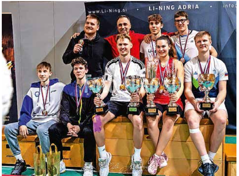
Veseli ob dosežkih na državnem članskem prvenstvu