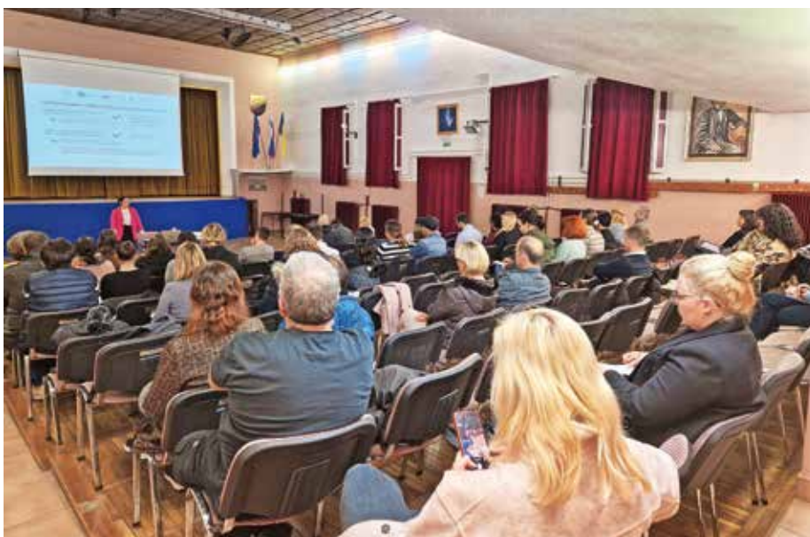
Na delavnici je bilo približno 40 udeležencev.

Teden dni po zaključku zbiranja prijav na javnih razpisih s področja družbenih dejavnosti je bil objavljen sklep o izboru vlog, ki so bile oddane za sofinanciranje otroških in mladinskih programov v občini Medvode v letu 2024. Sredstva so bila razpisana v višini 15.000 evrov, vrednost prejetih vlog pa je znašala 24.000 evrov, je razvidno iz objave sklepa. Pristojna komisija je pregledala in v skladu s pravilnikom o sofinanciranju otroških in mladinskih programov ocenila osem vlog s skupaj 17 prijavljenimi programi, in sicer 14 projekti ter tremi poslovanji. Zavzela je mnenje, da se za programe poslovanja nameni točno deset odstotkov vseh razpisanih sredstev, kar je skladno z 12. členom pravilnika, ter da se ta sredstva namenijo le mladinskim organizacijam. Za programe projektov je bilo dodeljenih 90 odstotkov razpisanih sredstev.