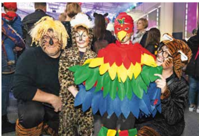
Džungla iz Vaš na pustovanju v Medvodah