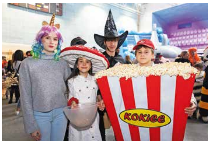
Skupino maškar iz Zbilj so sestavljali samorog, mušnica, čarovnik in kokice.