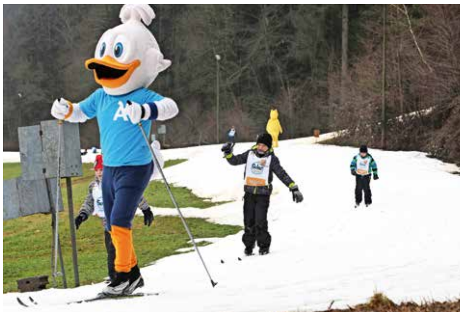
Šolarje so pri teku na smučeh spodbujale tudi maskote.