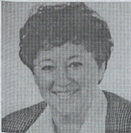
Gospa Golob: Človek se vsemu privadi...

Seveda lahko! S Slovenskimi plinovodi, ki