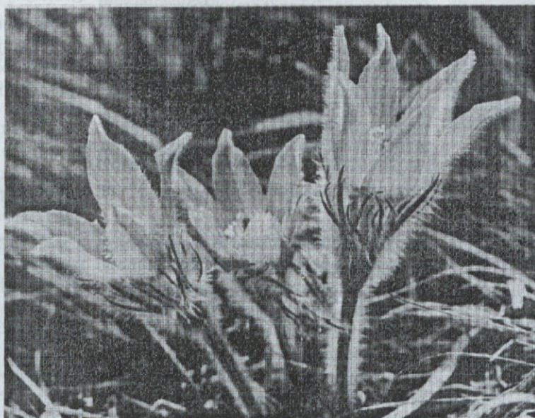
Velikonočnica na rastišču Boletina pri Ponikvi