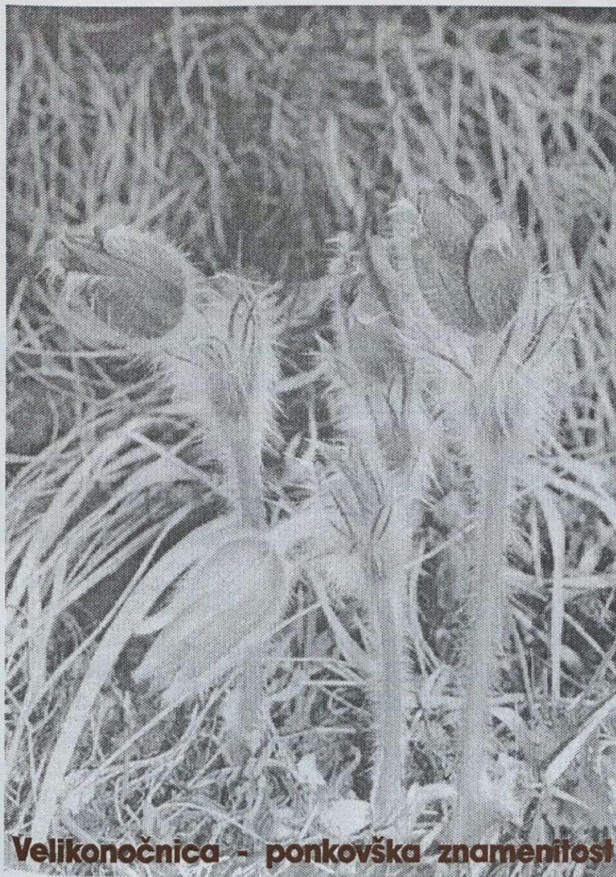
Velikonočnica - ponkovška znamenitost