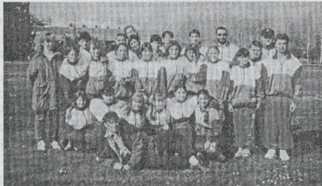
Atletski klub Trgohlad na DP