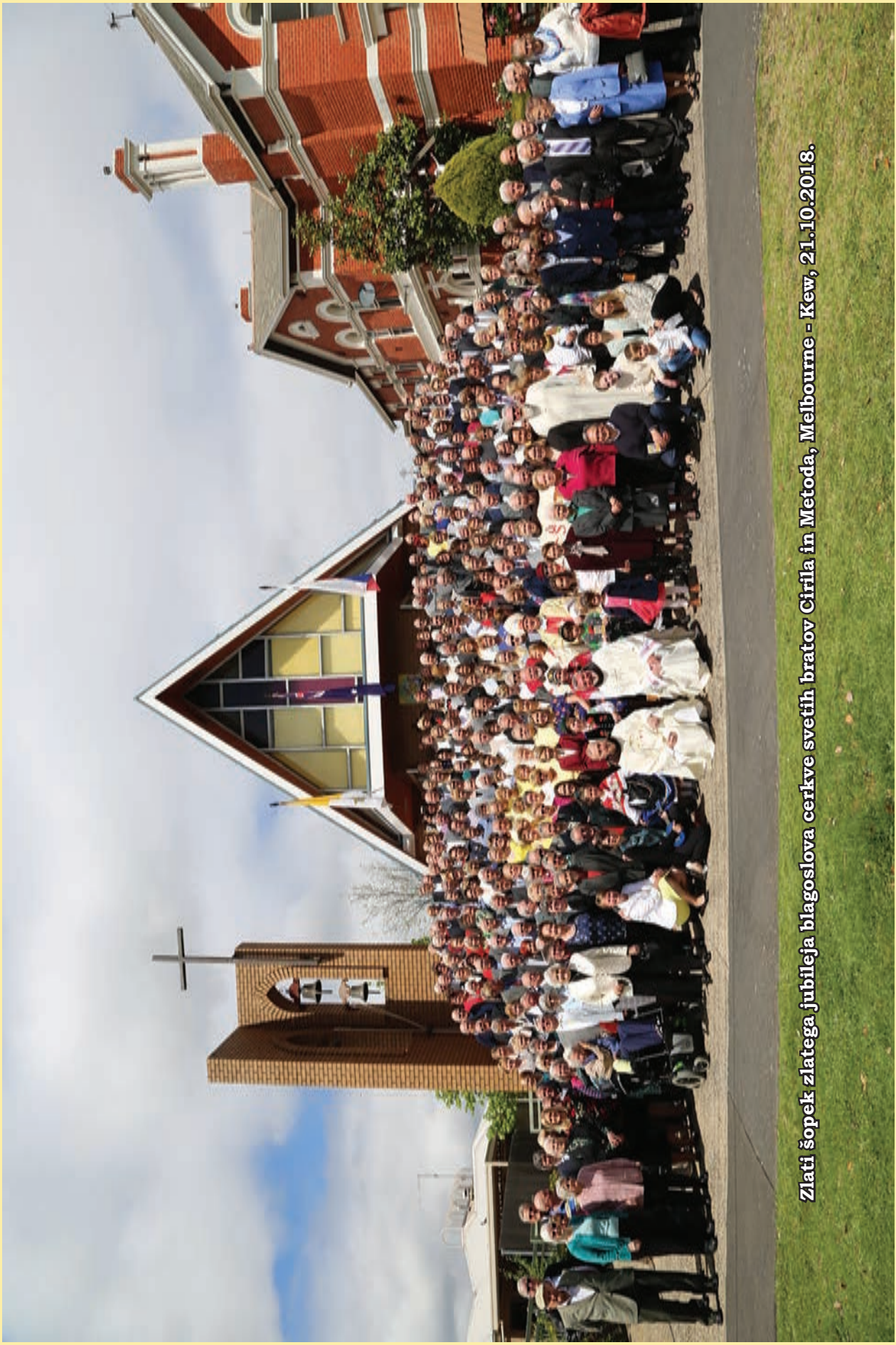
Zlati šopek zlatega jubileja blagoslova cerkve svetih bratov Cirila in Metoda, Melbourne - Kew, 21.10.2018.