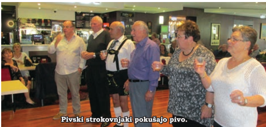
Pivski strokovnjaki pokušajo pivo.