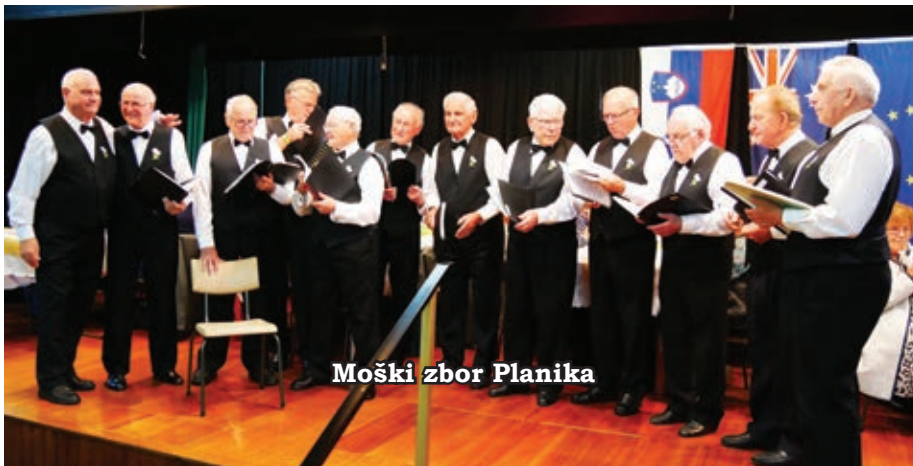
Moški zbor Planika