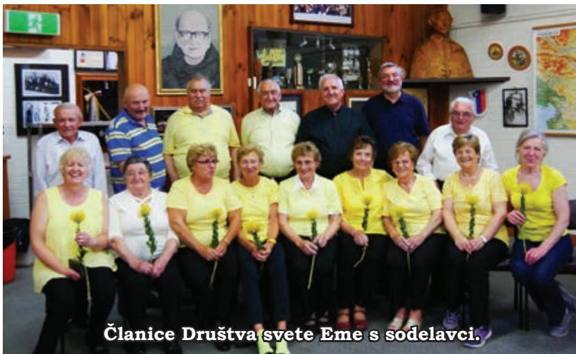
Članice Društva svete Eme s sodelavci.