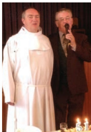
Del nove restavracije, pripravljen za poročno slavlje.