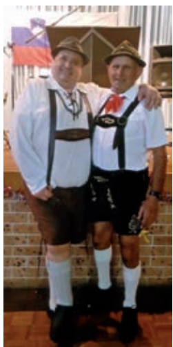
Člana ansambla Alpski odmevi v nemški narodni noši, za Oktoberfest.