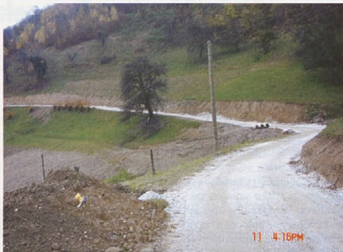
Prva faza obnove ceste v Ložini

V prihodnjem letu nameravamo z začetno prakso nadaljevati. Zavedamo se, da naveden pristop ni idealen, in da so kritike o potrebi sofinanciranja do določene mere razumljive in upravičene, vendar je to za sedaj dejansko edini način, da ob sprejetih kredi-