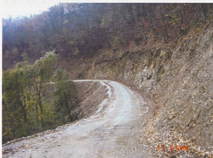
Prva faza obnove ceste v Ložini

Novembra smo uspešno zaključili 1. fazo projekta Modernizacija in rekonstrukcija cest na območju naselja Ložine, za katerega smo na razpisu Razvoj obmejnih območij s Hrvaško uspeli pridobiti državna oz. evropska sredstva v višini 500.000,00 EUR.