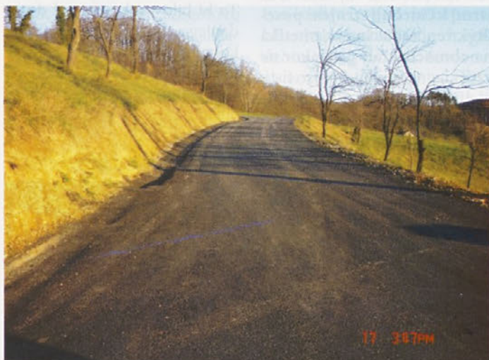
Asfaltiran odcep od lokalne ceste mimo Svenškovih v spodnjem Podlehniku