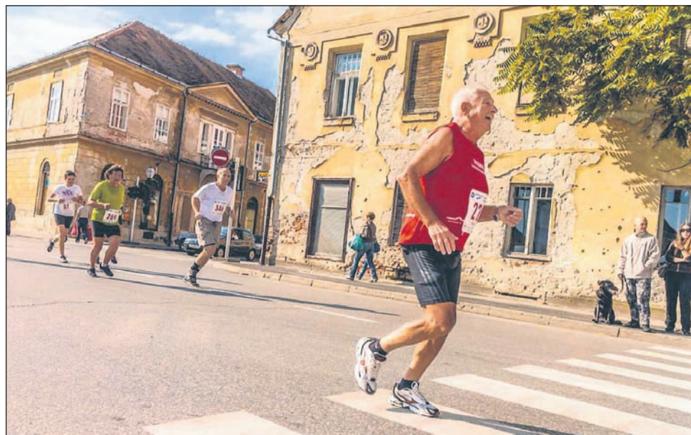
Neutruden tekač, ki je lahko s svojo aktivnostjo vzor marsikateremu mlajšemu ljubitelju rekreacije.