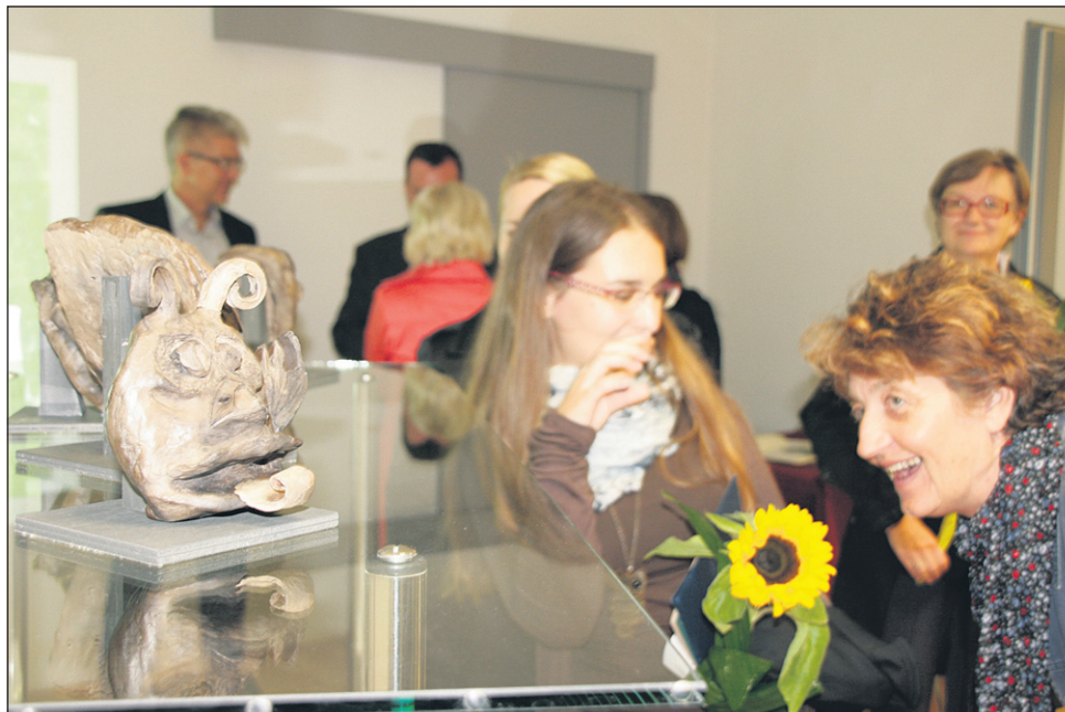
V razstavišču PSC Hajdina je na ogled razstava mask Zeleni in divji možje.