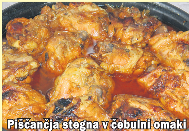
Piščančja stegna v čebulni omaki