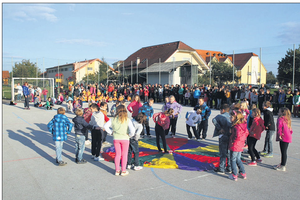
Ob dnevu OŠ Hajdina so se predstavili številni mladi športniki.