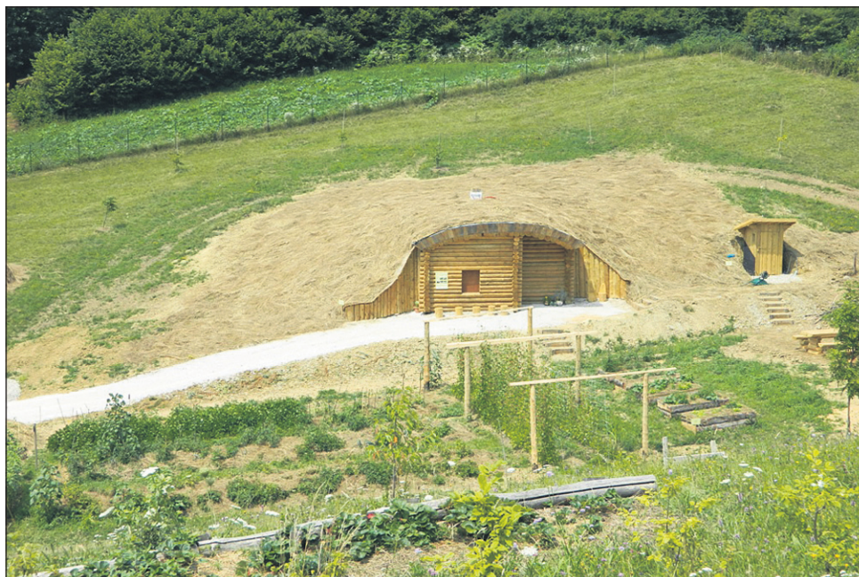
Pogled na zemljanko

Z žarom v očeh je pokazala na gredo s sončnicami: »Tukaj vidite eno gredo, kjer so sončnice. Tista zemlja je bila