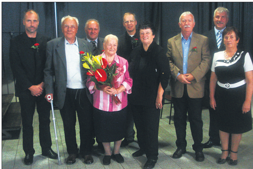
Utrinek s srečanja starejših občanov Podlehnik