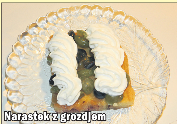
Narastek z grozdom