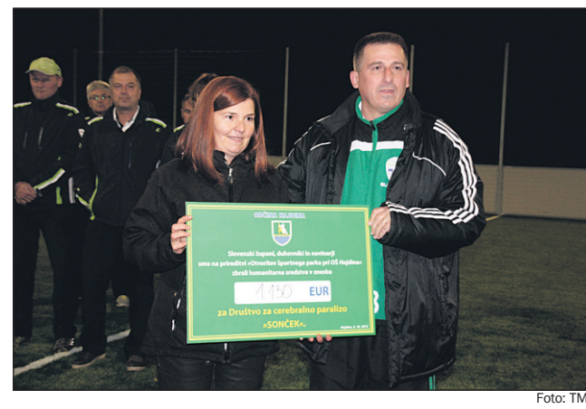
Na humanitarni prireditvi za Sonček so predsednici Društva za cerebralno paralizo Ptuj-Ormož predali ček v višini 1130 evrov.