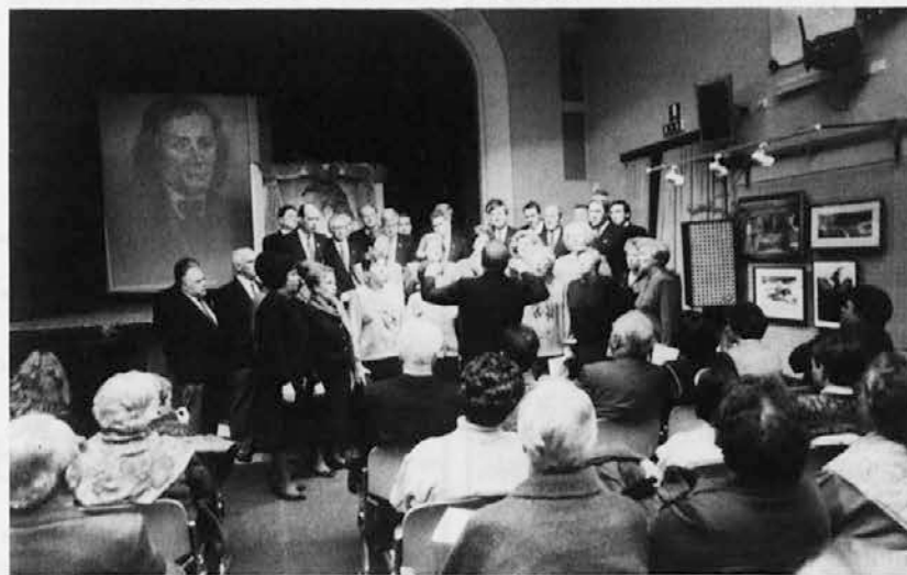
Tako je bilo na Prešernovi proslavi v Prosvetnem domu na Opčinah