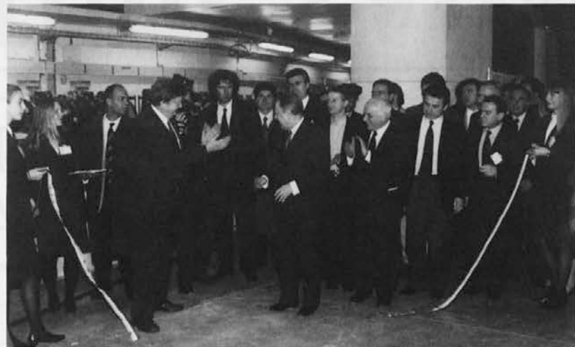
Predsednik vlade Ciampi je prerezal trak in s tem slovesno odprl sinhrotron Elettra