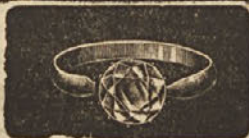
Trgovina z urami in zlatino F. CUDEN, Ljubljana, Prešer- nova ul. 1.

z vsemi pripadajočimi stroji, surovinami in zgotovljenim blagom. Dopise pod „G. L. 1000“ na upravo „Jugoslo- vanske burze“.