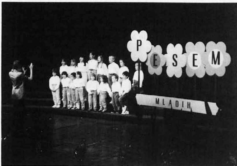
Mali pevci na odru Kulturnega doma