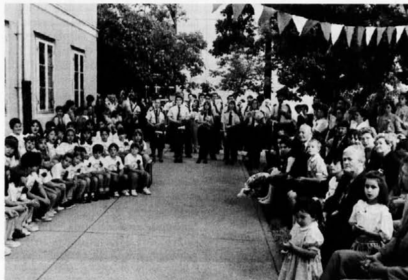
Šolarčki med slovesnostjo na dvorišču častitljive šolske stavbe na Proseku