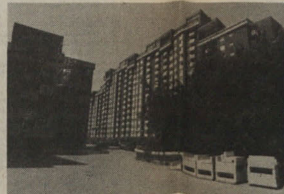
V stanovanjski soseski BS 7 „Ruski car“, kjer je skupno 2500 stanovanj, smo izvedli 70 odstotkov celotne stanovanjske gradnje.