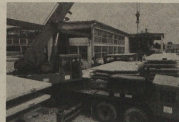
Imamo tudi lastne obrate gradbenih polizdelkov, ki delujejo v TOZD Gradbeni polizdelki-proizvodnja.