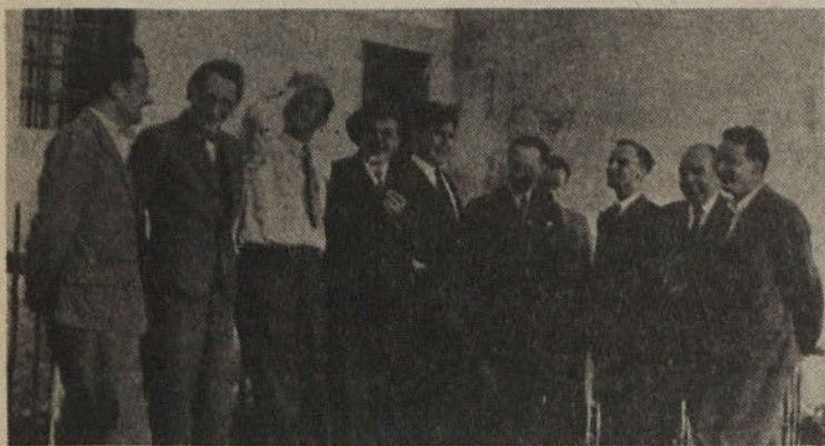
Louis Adamič s slovenskimi slikarji.

PRIJAVE ZA SODELOVANJE NA DŠI-81 POŠLJITE NA OBČINSKI SVET VSAJ 5 DNI PRED VSAKIM TEKMOVANJEM, OZIROMA SE PRIJAVITE DIREKTNO VODJI TEKMOVANJA.