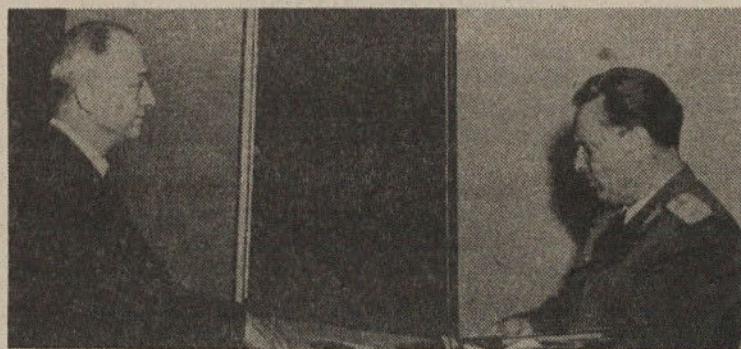
Predsednik Tito in Louis Adamič.