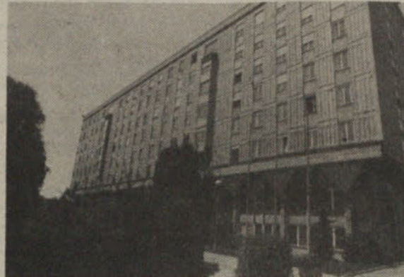
Zgradili smo tudi Fakulteto za arhitekturo, gradbeništvo in geodezijo v Ljubljani.