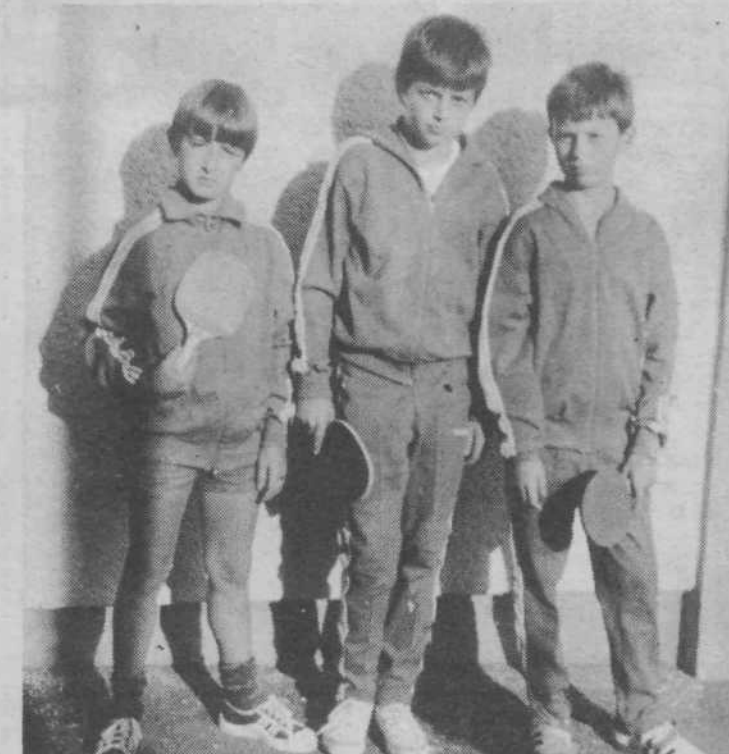
Trije od najboljših, ki zmagujejo na letošnjih tekmovanjih

Že v prvi tekmi, ko so naši odpravili domačine iz Kranja z rezultatom 5:1, je bilo videti, da je ekipa solidno pripravljena. Posebno dragocena zmagala je bila nad Kemičarjem iz Hrastnika, ki je trenutno že drugo leto najboljši v republiki. Zaloški pionirji so to tekmo dobili z rezultatom 5:3. Za vstop med najboljše štiri ekipe pa so izgubili z rutiniranimi igralci Maribora.