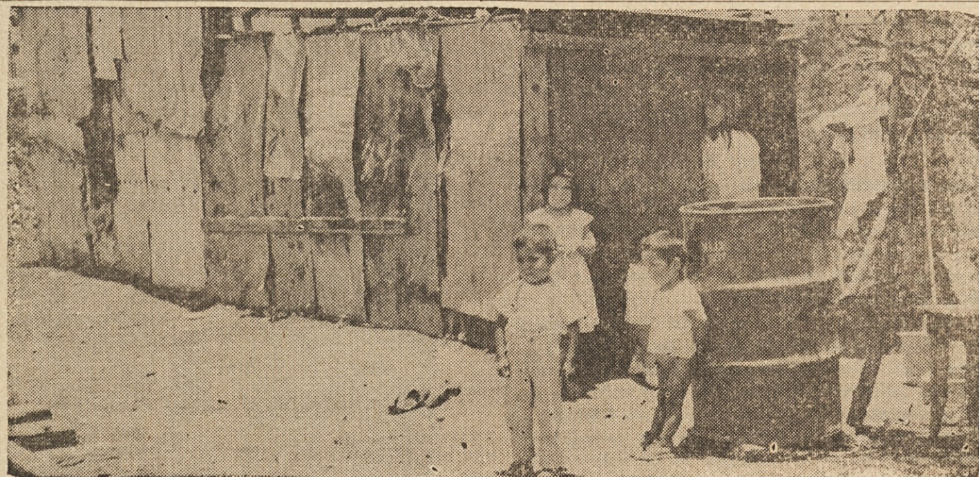
DOSTI DELA ZA NAPREDEK — Zveza za napredek deluje tudi v Mehiki. Kot kaže posnetek s predmestja Mexico City, ji dela še ne bo kmalu zmanjkalo.