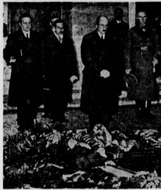
S pogrebu belgijskega kralja je bolgarski kralj Boris odšel v Berlin, kjer je obiskal nemške državne. Pod spomenik slave je položil venec. Na desni: Kralj Boris zapušča predsed. palačo.