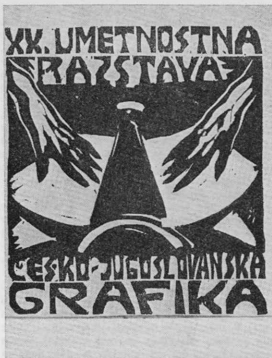
Naslovna stran razstavnega kataloga Češko-jugoslovske grafike, Jakopičev paviljon, januar 1922