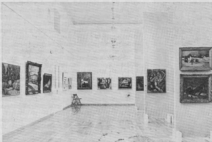
Pogled v Razstavno dvorano ob priliki razstave Češko in slovaško slikarstvo med vojnama, Narodna galerija, julij—avgust 1978