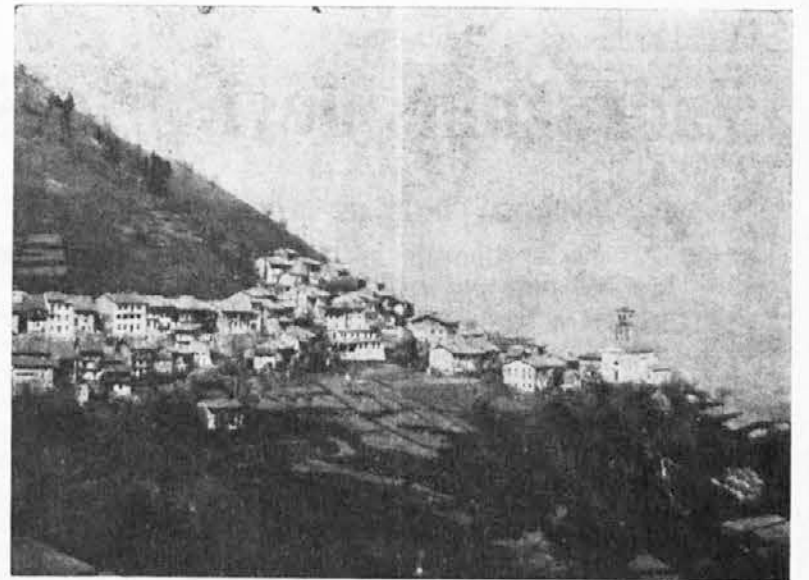
PROSNID je najbolj oddaljena in zakotna vas tipanske občine, njegovo naravno izhodišče pa je Ahten, s katerim so tudi povezani z redno avtobusno progo. Vas pa ne bi bila tako zapuščena, če bi obmejni prehod na Mostu čez Nadižo spremenili v prehod prve kategorije, a o tem problemu bomo govorili v eni izmed prihodnjih števil

V okviru gospodarskega programiranja, ki ga uveljavljajo v naši deželi, bi morali posvetiti večjo skrb potrebam in težnjam emigrantov, ti pa naj bi imeli tudi prednost pri zaposlitvi v raznih industrijskih dejavnostih in drugih obratih, ki jih v Furlaniji-Juljski krajini zgrade z državnimi prispevki. Zlasti pa se zavzemamo za ustanovitev posebnega deželnega urada za zaposlovanje, ki bi ga priznala tudi država. Žalostno je namreč sedaj ugotavljati, da delujejo razni uradi in ustanove le za vzporeja-