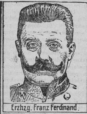
Erzherzog Franz Ferdinand