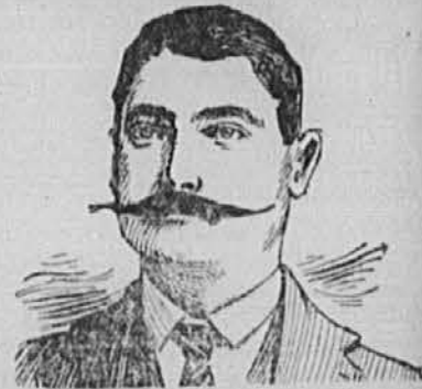
Universal Medical Institute New York

možje in žene, mladeniči in starčki, dečki in otroci, priznavajo ozdravljenje po zaužitju zdravil tega zavoda. Vspheh tega novega obličja le v tem, ker ima svoj poseben zdravniški zbor raznih specialistov za vsaktero sledečih bolezni: Ravmatizem, srčne hibe, nalezljive bolezni, kožne bolezni, očesne, ušesne bolezni, bolezni v nosu, grlu in prsih. Ako zgubljate lase, če vas boli želodec, dalje, za spolske bolezni, za hemoroide, odrvenenje kakega uda, kapljavico, sifilis, impotenco, neredno mesečno čiščenje, krvne in trebušne bolezni, oslabelelost telesa in vsakojake druge bolezni.