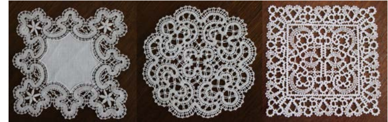
Križčevke v širokem in ozkem risu

žine risal Idrijčan Albin Mažgon. V svoj zvezek naročil je konec leta 1939 med drugim zapisal: »1 rom v 4 vogle iz križčevk (prazn po sredi) 30 x 30 cm«; pa tudi naročila za kroge, ovale, manšete, krstne oblekice (»oblekce« in »avbca«) z motivom križčevk v ozkem risu. Njegove vzorce je poznala tudi Zorka Rupnik, risarka vzorcev za idrijsko čipko, ki je tudi sama zrisala veliko vzorcev v tej tehniki. 5 Za prodajo so se križčevke v širokem risu klekljale še v drugi polovici 20. stoletja za obrobe namiznih prtov in garnitur, kot okviri različnih oblik in dimenzij, v ozkem risu pa kot samostojni čipkasti prtji.