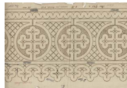
Vzorčna predloga in fotografija s cerkvenimi čipkami. Hrani Mestni muzej Ljubljana (MGML).

V Mestnem muzeju Ljubljana hranimo starejšo vzorčno predlogo za »cerkveno čipko« iz prve polovice 20. stoletja. S svinčnikom je na vzorcu zapisano 21. 4. 22, verjetno je to datum naročila za izdelavo čipke, sam vzorec pa je zagotovo starejši. 6 Čipka je lahko služila za obrobo albe ali roketa, mogoče tudi oltarnega prta. Med linijo rogljičkov ob zgornjem robu in križčevk ob spodnjem robu se v osre-