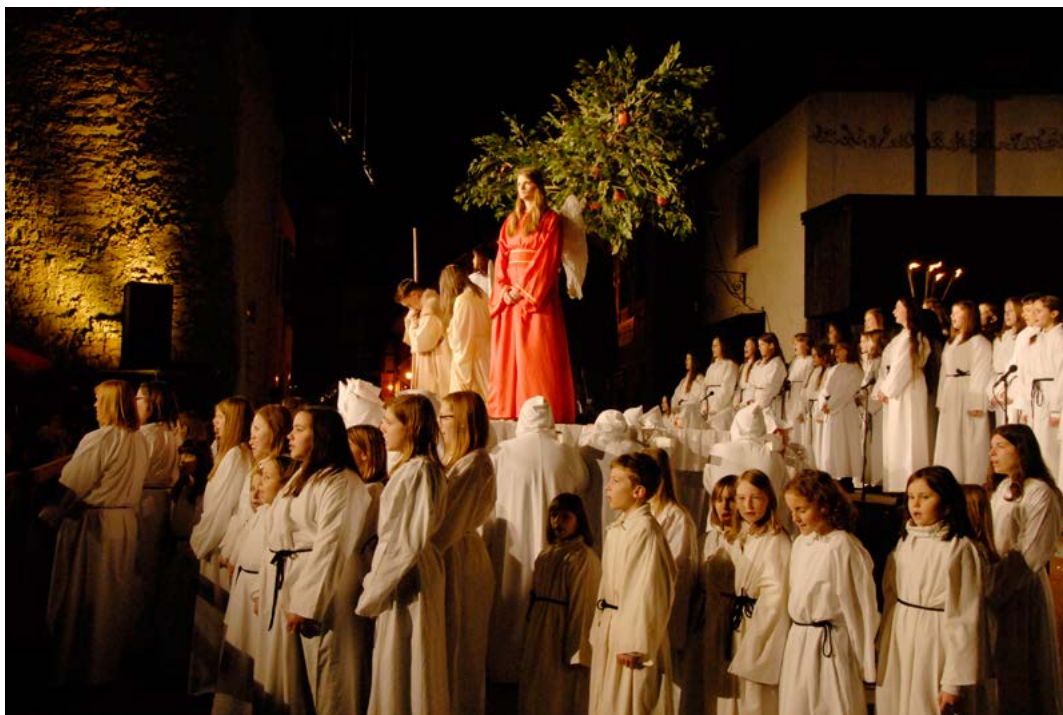
Prizor Raja na četrtem prizorišču pri Kašči, 2015.