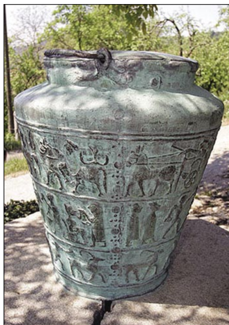
Mala kankla iz Vač s figurami (kopija)

kak milijon pa pau ton kulna vöskopali. V šestdeseti lejtaj je v krajini 8 gezero rudarov (bányász) delalo. Gnes kopajo kuln več samo v Trbovljaj pa Hrastniki. Zemla je zavolo kopanja méka, zatok se včasi počujnsne.