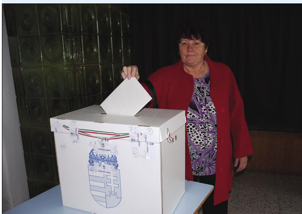
Volivci so prihajali večinoma pred in po maši