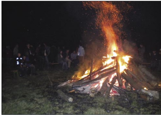
Za drva so poskrbeli andovski podje, za toplino pa ogenj, kauli steroga se je fajm dalo pogučavati

Gda smo ešče mlajši bili, smo težko čakali velko soboto, ka so nas te večer pistili k ognju, steri naj bi simboliziro, ka je Jezuš od mrtvi vstau. Po vsakšoj