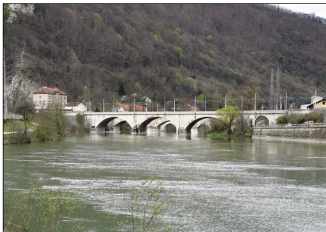
V Zidanom Mausti se srečajo poti

Prva kak bi začnili svojo paut dale po Savi prauti Ljubljani, se moremo spomniti na tau, ka so leta 1573 pavri v krajini med rekama Savov pa Sot-