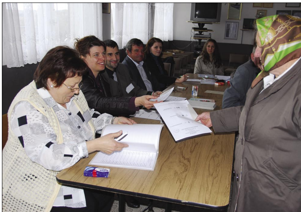
Volilna udeležba je bila v večini porabskih vaseh nadpovprečna

Niti celega odstotka glasov ni dosegla druga nova stranka na madžarski politični paleti, t. i. Civilno gibanje, ki, kot kaže tudi njeno ime, je orga-