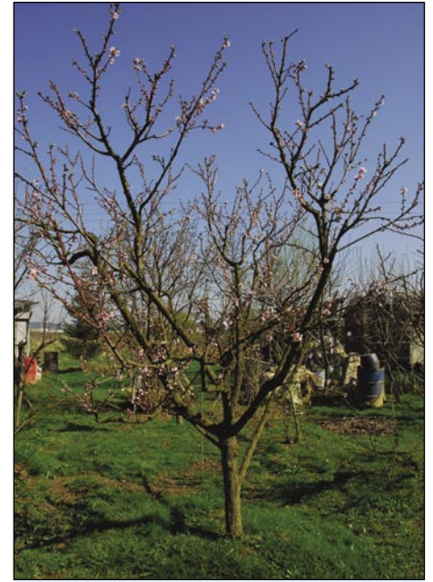
Breskvi zdaj začnejo cvesti

Mam tū eden mali bungalo, gde škir mam, pa gde si malo