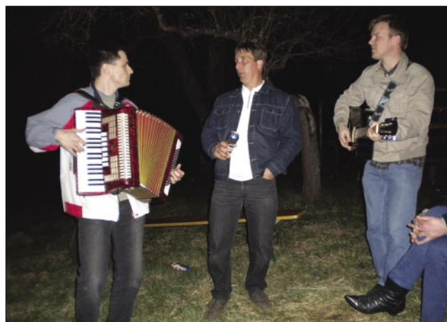
Büdinski podje so glasbeno škir tö nej doma njali

Gnesden šega ovakša gratüvla. Po nistrni vesnicaj več ne gorijo ognji radosti, ali pa kakša iža samo zaszé zaküri mali kres. Po več vesnicaj pa samo na enom mesti zakürijo ogenj. Tau organizira kakšno družstvo, športno, gasilsko ali kulturno. Nejga več žive muzike, nej spejvanja, liki iz najnovejši aparatov se