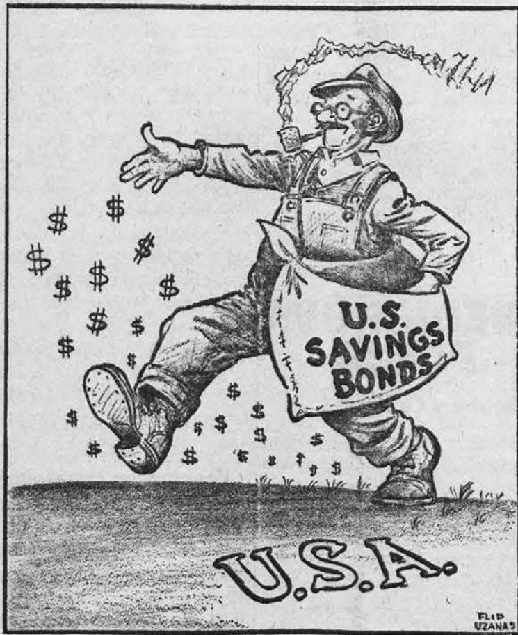
KAKOR BOSTE SEJALI, TAKO BOSTE ŽELI

Društvo Združeni bratje, št. 26 SNPJ ima v nedeljo svoj piknik na farmi SNPJ, Chardon in Heath Rd. Igrala bo izvrstna godba za vse, ki se radi zavrtijo na plesišču, pridne kuharice in natakariji bodo pa postregli z vsakovrstnimi okrepčili. Zabave v prosti naravi bo dovolj za vse posetnike in društvo se pripoveda članstvu in ogledu za obilen poset.