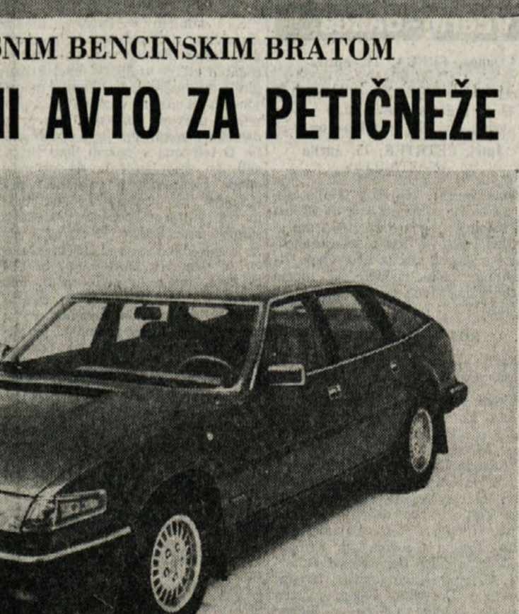
V zunanosti se rover turbodiesel ne razlikuje od svojih bencinskih bratov

BOLOGNA — Imperativ današnjega časa je varčevanje in to se odraža tudi v proizvodnji nekaterih avtomobilskih hiš.