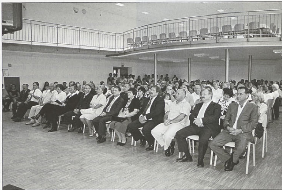
Župan v družbi gostov, sodelavcev in občanov na osrednji prireditvi ...