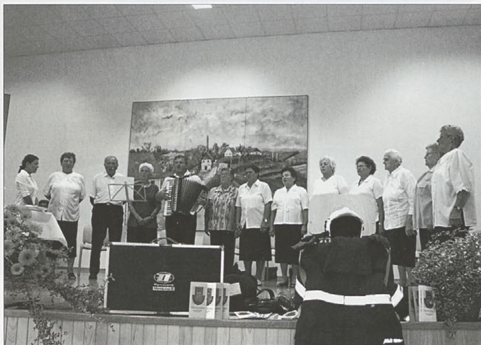
Završki ljudski pevci in pevke večkrat zapojejo skupaj.

V KUD Maksa Furjana Zavrč so bile vse sekcije v tem letu zelo aktivne, posebno še ljudske pevke, ki so opravile številne nastope doma in tudi v širši okolici. Na januarskem srečanju ljudskih pevcev in godcev, ki ga