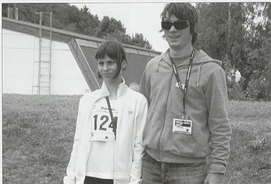
Doroteja s svojim trenerjem.