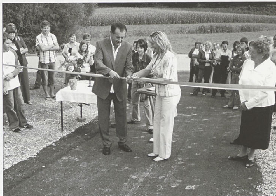
Ob prazniku so odprli tudi modernizirano cesto v Pestikah (odsek Bratuša - Slameršek).