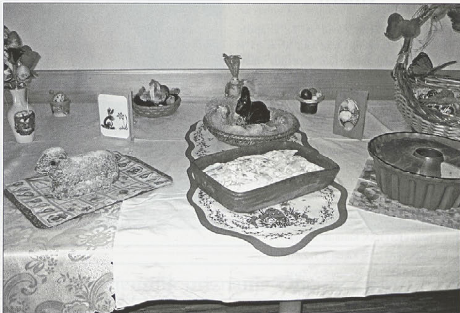
Velikonočna razstava je bila bogata, vredna ogleda.

Vse velikonočne dobrote smo potem tudi narezale in ponudile našim obiskovalcem,