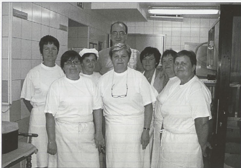
Ob pomoči spretnih rok so se Zavrčanke na Ptujju odlično znašle. Vse čestitke!