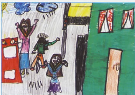
Na poti v šolo in domov, Samanta Škrinjar, 3. r.

Operacija se izvaja v naselju Zavrč. Pričela se je izvajati v letu 2008 in se bo zaključila leta 2009.