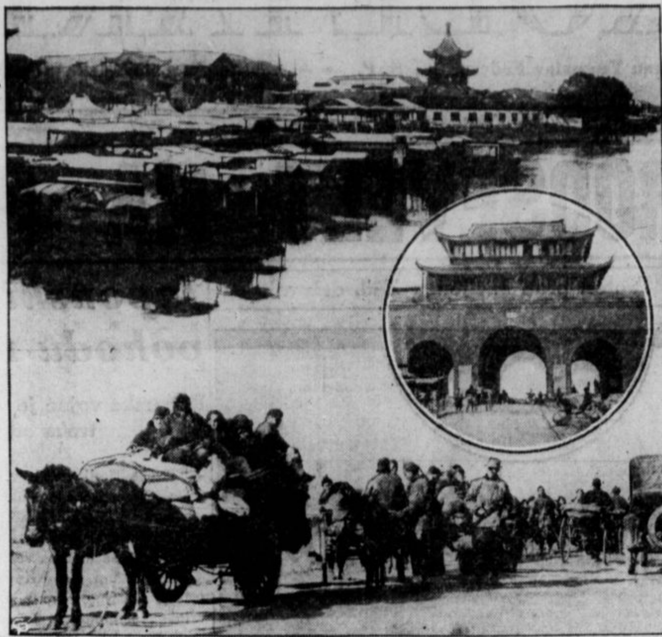
Beg Kitajcev iz mest, katera napadajo japonski aeroplani. Veliko prebivalcev je bilo ubitih. V Sangaju in drugod, kjer Japonci širijo svojo "civilizacijo", je bilo porušeno mnogo hiš in tudi požar, ki so ga zaneli letalci, je napravil znatno škodo. V Sangaju so ubili tudi nekaj Američanov.