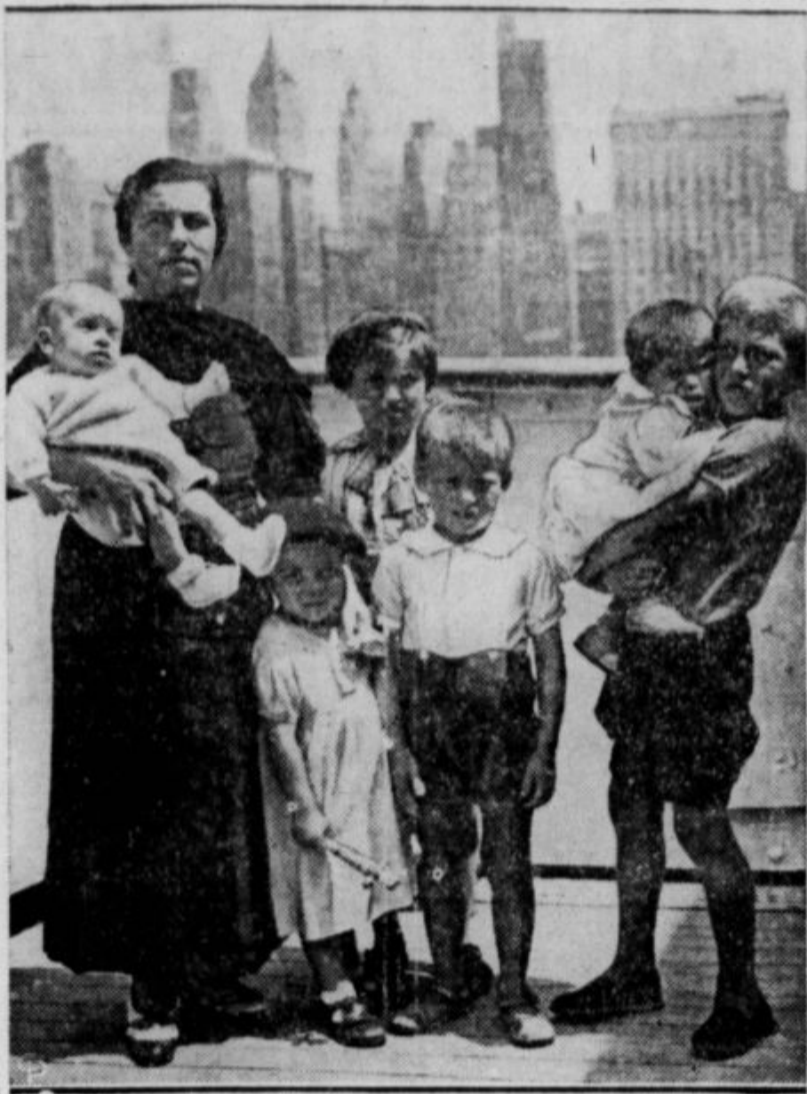
Na sliki je Španka s svojimi šestimi otroci, ki je prišla iz Santanderja v New York. Njen mož je v armadi. Tu je bila družina ustavljena. Razni ameriški odbori si že dolgo prizadevajo dobiti dovoljenje ameriške vlade za ustanovitev tabora za španske sirote. Ni jim uspelo, ker kvote za priseljevanje tega ne dopuščajo. Vsaj tako tolmači vlada. Največ španskih sirot in žensk je dobilo zavetje v Franciji, Angliji in Belgiji. Ameriški delavci taborom španskih beguncev denarno pomagajo.