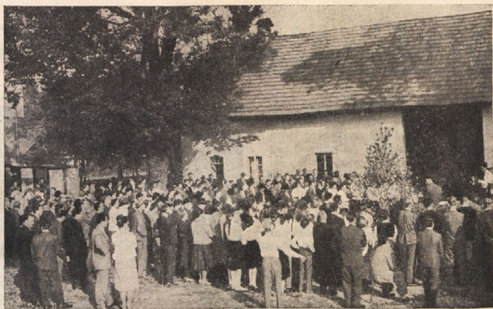
Pogled na del udelažencev prireditve v Podravljah

Kmetijska šola v Podravljah, ki že več let uspešno skrbi za strokovno izobrazbo našega kmečkega naraščaja, je bila zadnja nedeljo prizorišče koristne in zanimive pri-