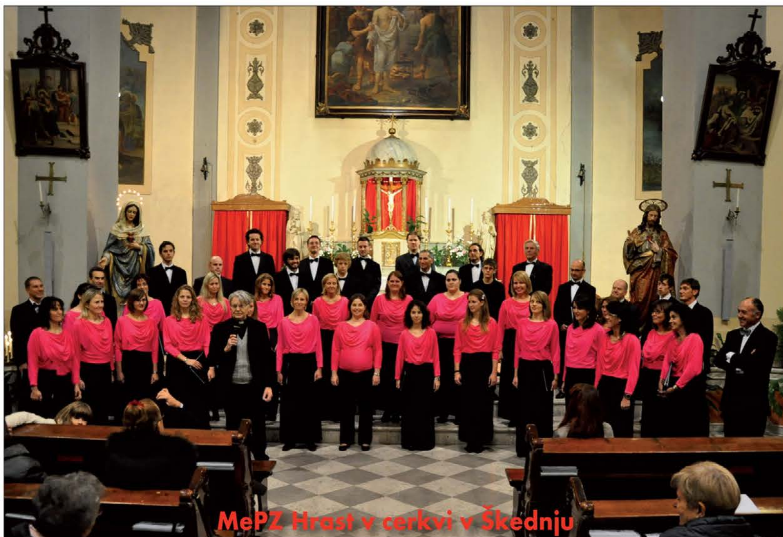
MePZ Hrast v cerkvi v Škedenju