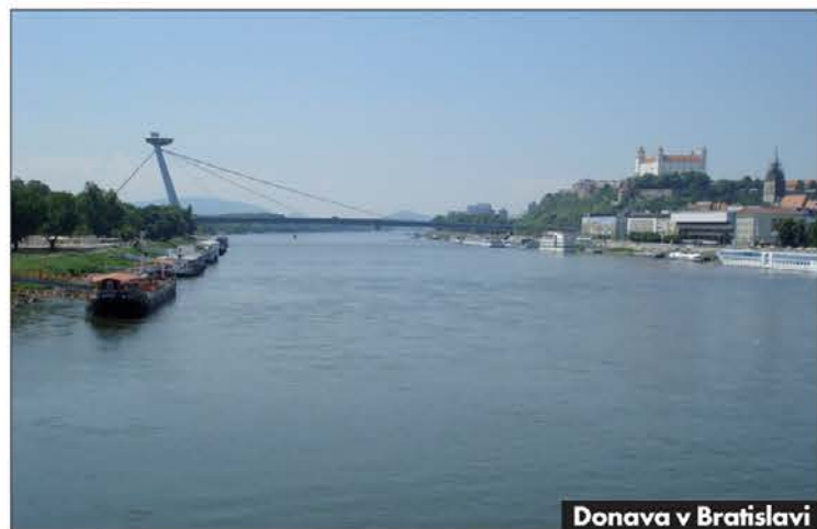
Donava v Bratislavi

vzhodno Evropo, med Evropo in Balkanom"? sem se spraševal. V Downtown backpackers Hostlu sem na notranjem dvorišču zagledal Matthiasov bicikel in bil ob tem zelo vesel. Srečno naključje je hotelo tudi, da sem med nekaj