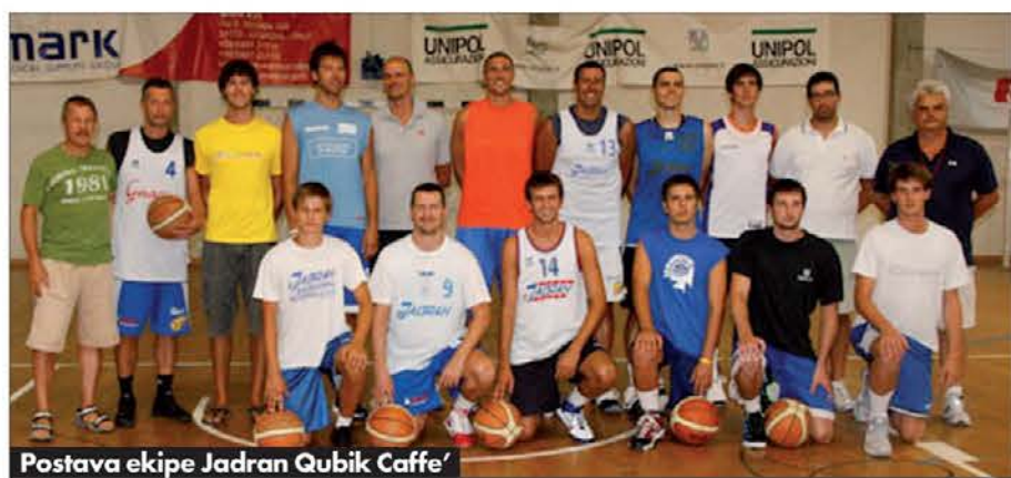
Postava ekipe Jadran Qubik Caffè'