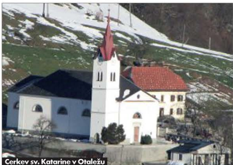
Cerkev sv. Katarine v Otaležu