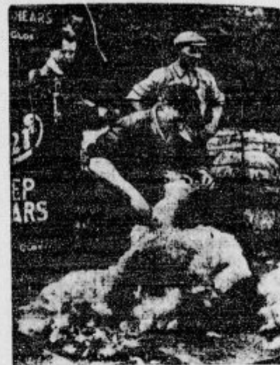
V Ameriki strižejo ovce s posebnimi škariami na električni pogon.

d Glavni odbor Davidovičeve demokratske stranke je sprejel na svojem zborovanju zanimivo resolucijo, ki med drugim zahteva: Za izvedbo temeljitih preuredb je treba združiti vse sil naroda na programu, ki bi pomenil izmirjenje sedanjih političnih in vseh drugih nasprotstev. Nova ustava mora biti skupno delo Srbov, Hrvatov in Slovencev. Temeljiti mora na parlamentarnem načelu. Ljudstvu se morajo dati sva uprave, stranki in življenje se mora prosto