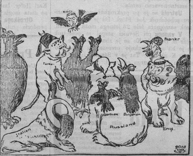
Die Panik im europäischen zoologischen Garten — oder der wahnsinnig gewordene Zaunkönig.

Zadnje čase se je zopet mnogo v Črnigoti govorilo; vsi važni politični dogodki so bili zaradi dogodkov v tej državi za trenutek pozabljeni. Na to dejstvo se zanaša tudi današnja politična karikaturna. Sužek ali palček (Zaunkönig) je najmanjši ptič; vendar pa je hotel postati kralj vseh živali. Naša slika kaže nato bajko in omeni to za njen napis: »Panika in evropskem zoologičnem vrtu ali znoreli palček«. Mi vidimo nemškega orla, turškega mačka, italijanskega leva, dvojnega avstro-ogrškega orla, nadalje ruskega medveda, kateremu sedijo srbska in bulgarska vrana na hrbtu, angleškega leva in francoskega petelina! Vsi so grozno razburjeni, kajti nad njimi frči prevzetni palček, črnogorski kralj Nikita. . . Slika boče gotovo mnogo smeha vzbudila.