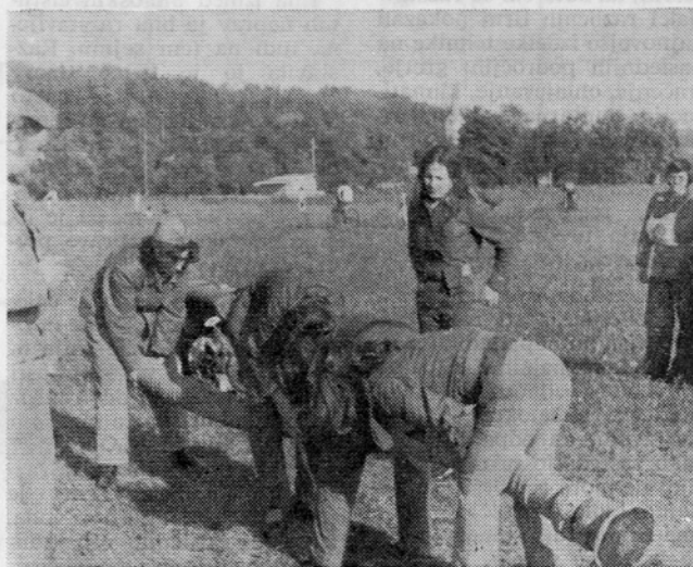
Naše gasilke pri spajanju sesalnega voda.

Za letošnje leto si je gasilsko društvo naše delovne organizacije, na pobudo Ob GZ oziroma GZS, ponovno zadalo nalogo, da bo usposobilo žensko gasilsko desetino, s katero bo nastopilo na republiškem tekmovanju v Velenju in na občinskem tekmovanju v Tržiču.