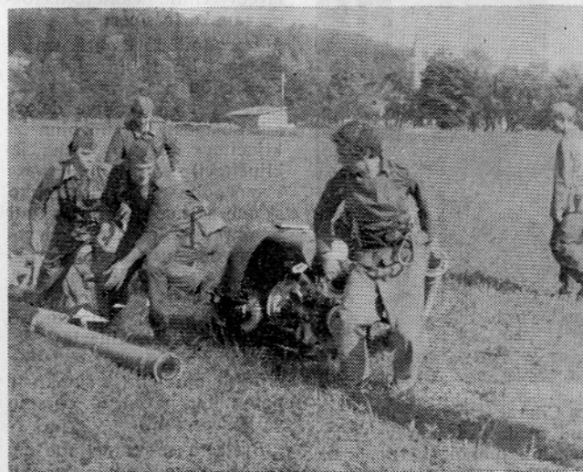
Moška gasilska desetina na eni izmed vaj.