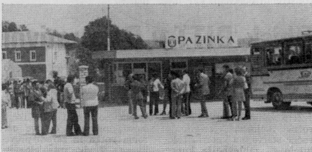
Pred vhom v podjetje.

tegorijam bodo pri sprejemanju v članstvo v bodoče posvetili več pozornosti. Glede pridobivanja in usposabljanja kadrov so nam povedali, da imajo kar v okviru podjetja srednješolski center za kvalificirane delavce, imajo pa tudi 11 slušateljev Višje tehnične tekstilne šole. Predavanja in izpiti tako za srednji kot za višji strokovni kader so v podjetju, vendar kot nekak oddelek zagrebške srednje oz. višje tekstilne šole. Zato so tudi predavatelji iz teh ustanov. Organizirajo tudi razne intenzivne te-