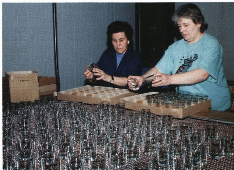
Pregledalke pri delu