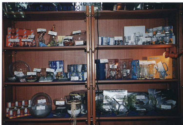
Prodajne police - komercialni teden Mercator Steklo Ljubljana

Steklarno Hrastnik in njene izdelke poznam. Imam jih tudi doma. Mislim, da so za široko porabo čisto zadovoljivi. Med vašimi in konkurenčnimi izdelki iz uvoza ne vidim kakšne razlike. Za nas potrošnike je pomembno le to, da so izdelki predvsem lepega videza. In vaši izdelki so, predvsem v zadnjem času lahko rečem, da so se popravili oz. izboljšali. V vaši industrijski prodajalni še nisem bila.