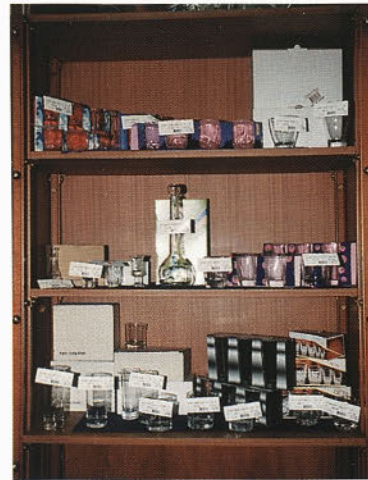
Prodajne police - komercialni teden Mercator Steklo Ljubljana