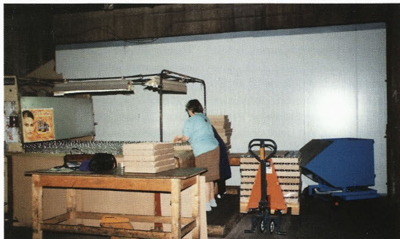
Nova oprema za testiranje