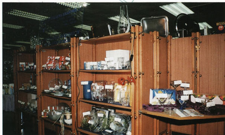
Prodajne police - komercialni teden Mercator Steklo Ljubljana

Steklarna Hrastnik je največji dobavitelj Alpeksa, ne glede na to ali je to porcelan ali steklo. Sledijo Duran, Bormioli in Durobor. Na splošno lahko rečem, da predstavlja prodaja stekla, tako gostinskega kot ostalega za gospodinjstvo med 65 - 70% mesečnega, s tem pa tudi letnega prometa firme Alpeks. Trg obdelujemo s pomočjo zastopnikov, t.j. samostojnih podjetnikov. Slovensko tržišče pokriva 6 zastopnikov, za vsako regijo posebej in lahko trdimo, da je dejansko pokrita celotna Slovenija, saj lahko naše izdelke najdete prav v vsaki trgovini, tudi takšni, ki je bila narejena iz garaže ali stanovanjskega prostora. Izdelki Steklarne Hrastnik so sprejemljivi, zanimivi. Sigurno ne morejo biti v tako širokem obsegu, kot ga lahko ponudi npr. Duran ali Bormioli, ki imata več velikih