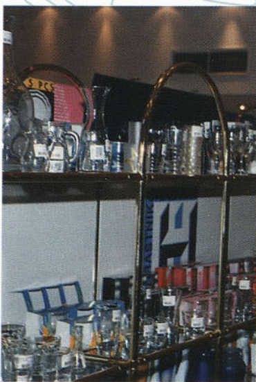
Naši izdelki v Alpeksu Celje