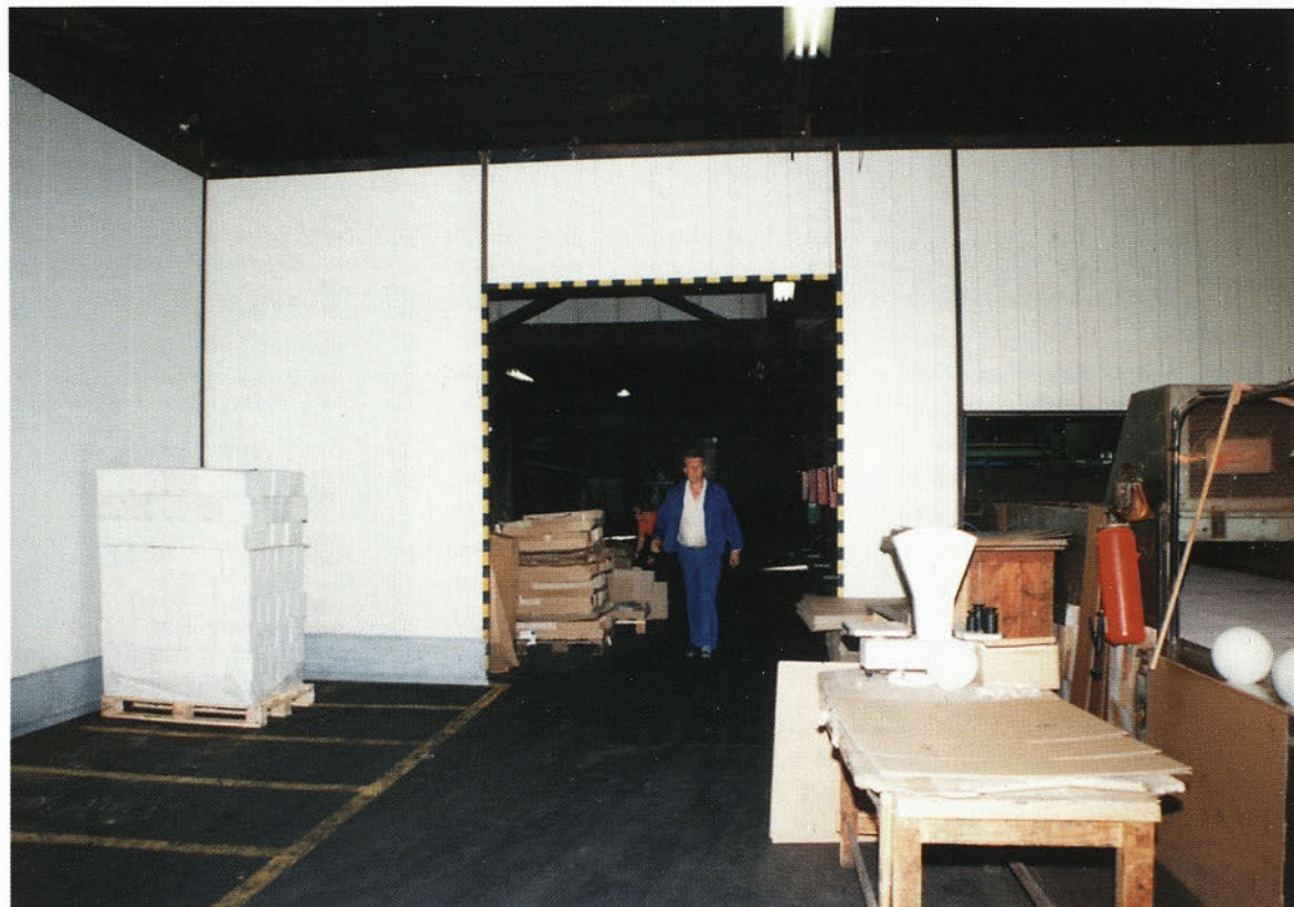
Pregradna stena med proizvodnjo in hladnim delom

Delavkam smo omogočili (zaenkrat v obratu, kjer obratuje I - kadna peč) tudi pregled izdelkov s