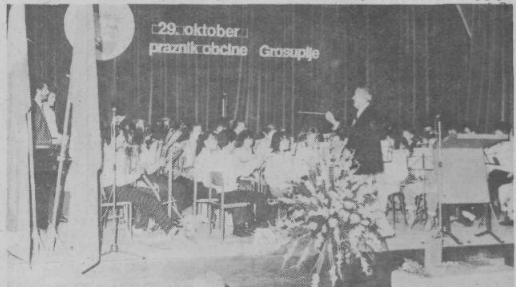
Pihalni orkester iz Grosupljeja je sodeloval v kulturnem programu na slavnostni seji

Kulturni del slovesnosti so izvedli: pihalni orkester in ženski pevski zbor iz Grosupljeja.