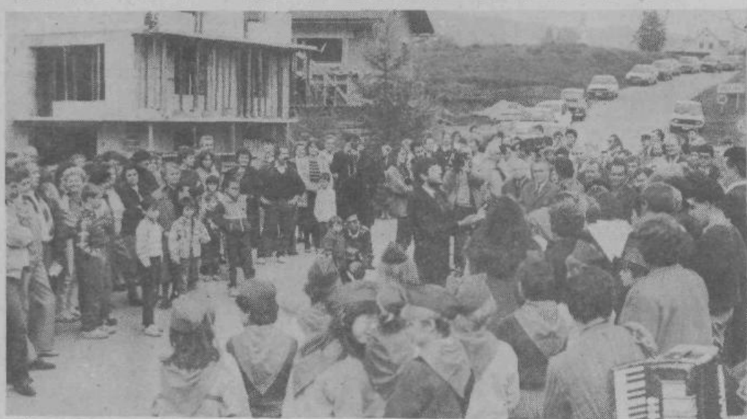
VIŠNJA GORA, 10. oktobra — Na slovesni otvoritvi obnovljenih cestnih odsekov Višnja gora — Peščenik — Kriška vas — Nova vas — Polževo — Zavrtče so se zbrali krajanje Višnje gore, predstavniki občine Grosuplje in izvajalcev del. Skupna dolžina novih asfaltiranih cest je 6550 metrov, kar je precejšnja pridobitev za KS Višnja gora.

Več kot tri četrtine dohodka gospodarstva občine sta ustvarili le dve področji: industrija (44%) in gradbeništvo (33%). Dohodek pa se je najbolj povečal v obrtni dejavnosti (IND 276), stanovanjsko-komunalni dejavnosti (IND 255) in trgovini (IND 246).