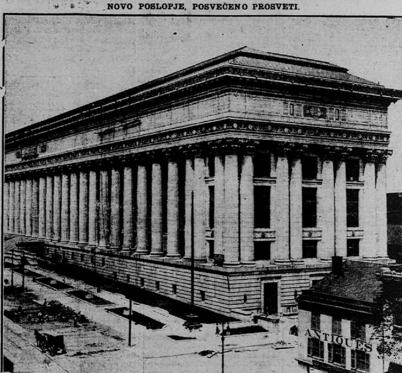
Naša današnja slika nam kaže krasno novo zgradbo v Albany, namenjeno vzgoji in posveti. Otvorjena bode dne 15. t. m. in je bila zgrajena s stroški 4 milijoni dolarjev.

Rim, Italija, 3. okt. — Italijanski zunanji urad zanikuje vsot, da je sklenjen mir med Italijo in Turčijo.