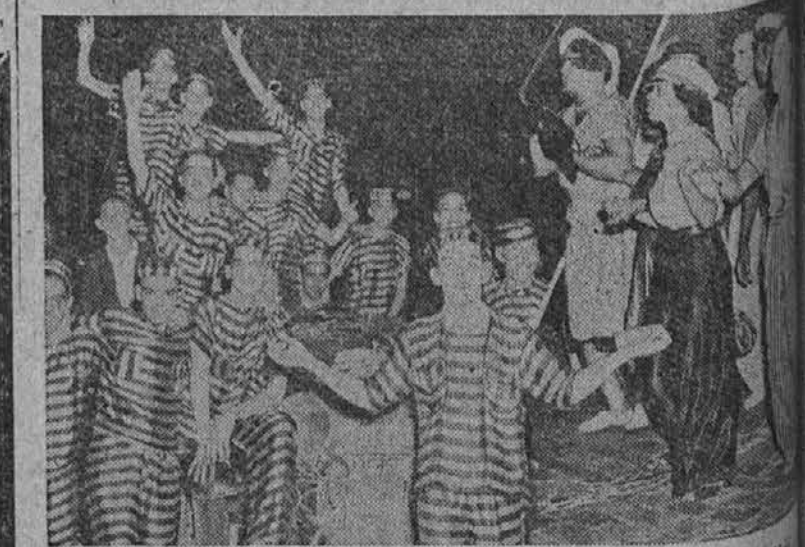
Prizor z ljudske veselice v Rio de Janeiro v Braziliji.