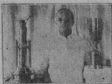
Preiskušena zdravila proti glavobolu

Odda se v najem soba s kopalnico, poštenemu fantu ali dekletu. Kdor želi naj se oglasi za naslov v uradu tega lista ali naj pokliče Henderson 5311.