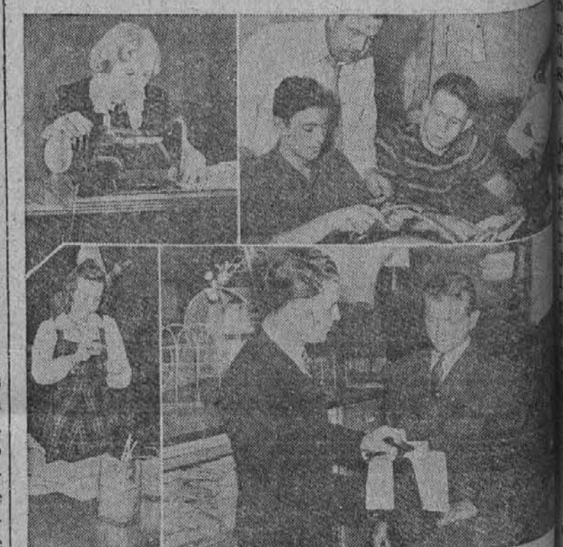
Na sliki vidimo prizore, ko se dijaki pripravljajo na konvencijo, ki se bo vršila 27. februarja v Chicagu.