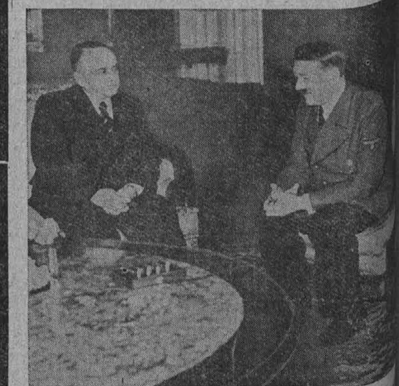
Na sliki vidimo kancelarja Hitlerja v razgovoru s sovjetskim poslanikom v Berlinu Vladimirjem Dekanovim. Kakor je videti na Hitlerjevem obrazu, je firar dobre volje.

V vsaki slovenski hiši s tukaj rojeno odraslo mladino bi morala biti knjiga