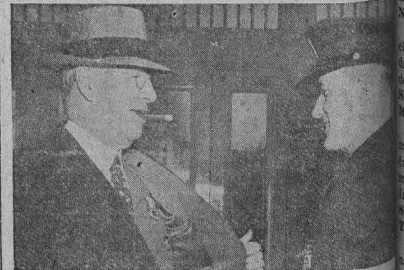
Vsi uslužbenci mornariškega departmenta, od dečka-tekača pa do mornariškega tajnika Knoksa, se morajo identificirati, preden vstopijo v department. Na sliki je mornariškega tajnika Knoksa, ki kaže stražniku svoj odznak.