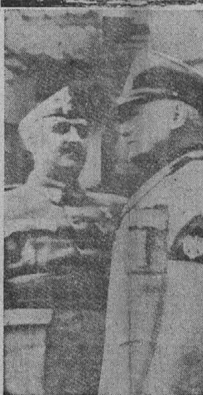
Prizor z zadnjega sestanka med Mussolinijem in generalom Francom. Kakor je videti, se Mussolini nič več tako bojevito in oblastno ne drži, kakor se je imel navado držati doslej.