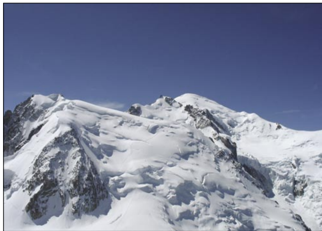
Najvišiji brejg Europe je »Bejla Plamina«

skoga kantona. (Kantoni so skoro takši kak pri nas županije, samo so menjši, 24 je majo v rosagi.) Če človek gde koli po Švajci odi, vidi, ka majo vseposedik vōdjane svoje radeče zastale z bejlim križom, tak so ponosni (büszkék), ka so Švajcarge.