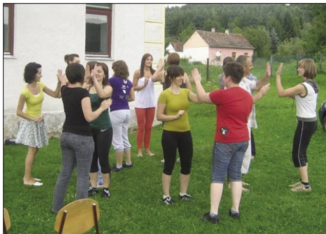
Na srečanju smo zaplesali ples, ki smo se jih naučili na plesnem tečaju, ki je bil organiziran v okviru sodelovanja s Klubom prekmurskih študentov

Mislím, da je prva igra jasna, drugi dve pa na kratko opišem. Kako smo ciljali s sodo v kozarce za kompot? Vsaka skupina je morala izbrati tri ljudi, ki so tekmovali. Dobili so dva kozarca za kompot in toliko sode, koliko so rabili. Zmagala je skupina, ki je prej napolnila kozarce. Čas je bil omejen, tekmovali so trikrat po eno minuto. To je