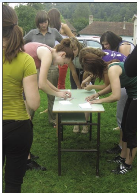
Tako smo zlagali delčke razglednic o porabskih vaseh

Prireditev je bila 13. avgusta v Sakalovcih na športnem igrišču. Ko smo jo organizirali, je izgledalo, da bomo ta popoldan preživeli skupaj, da bomo igrali različne igre, na koncu pa bomo imeli piknik. To se je malo spremenilo, tako da ni bilo piknika. Mladi smo se dobili v soboto popoldne ob dveh v Sakalovcih. Najprej smo se odločili, da bomo tisti, ki smo se lahko udeležili srečanja, zaplesali ples, ki smo