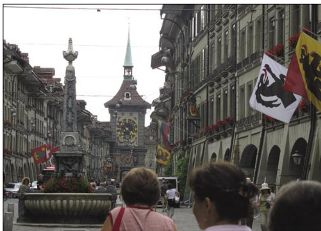
Glavni varaš Švajca Bern s tōrmom pa zastalami

Gda se popotniki pelajo mimo Züricha prauti sredini Švajca, majo čutenje, ka so ranč nej v Švajci. Ta krajina, štera se zove Mittelland , ali po našom 'srejdnja