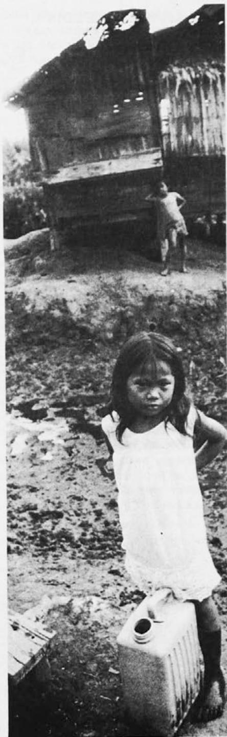
Primerjaj to sliko s svojim udobjem! Baraka namesto hiše, pomanjkanje in revščina na vsakem koraku, ni pitne vode... Kristus pa je rekel: »Kar ste storili kateremu izmed teh mojih najmanjših bratov, ste meni storili.«

»Dejansko pa jih imam sedemindvajset in počasi bom moral začeti misliti na starost,« se je zresnil Garth.