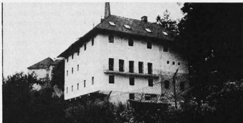
DOM V TINJAH, versko in kulturno središče naših koroških bratov

Resnici na ljubo moramo priznati, da je z orglami Maribor zares nadkrilil Ljubljano. Nove orgle namreč ne veljajo le za najboljše v Mariboru, ampak kar na celem Slovenskem.