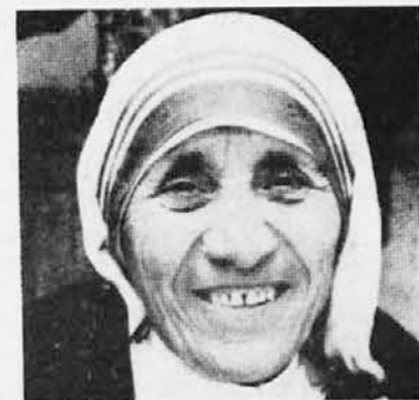
Kdo je ne pozna?