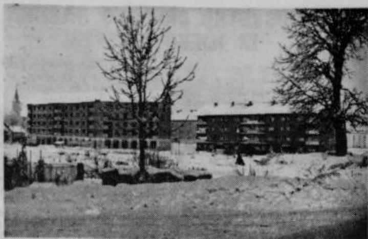
Se ena nova stanovanjska zgradba v Ciril-Metodovem drevoředu v Ptujju čaka na ugodnejše vreme in na nadaljevanje del.