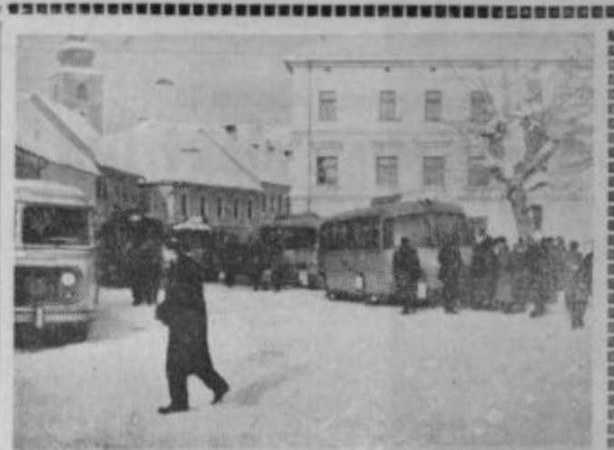
Prezeblji potniki napolnijo avtobus za avtobusom na ptujski avtobusni postaji. Mnogi se ne vedo, da je v bivši Simoničevi torbarni avtobusna čakalnica.