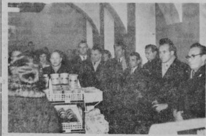
Predstavniki političnih organizacij, občine in podjetij na otvoritvi samopostrežnice »Panonije« v Ptuj.

kakršnokoli postrežbo. Zahtevnosti poskušata dorasti postrežba in tudi godba.