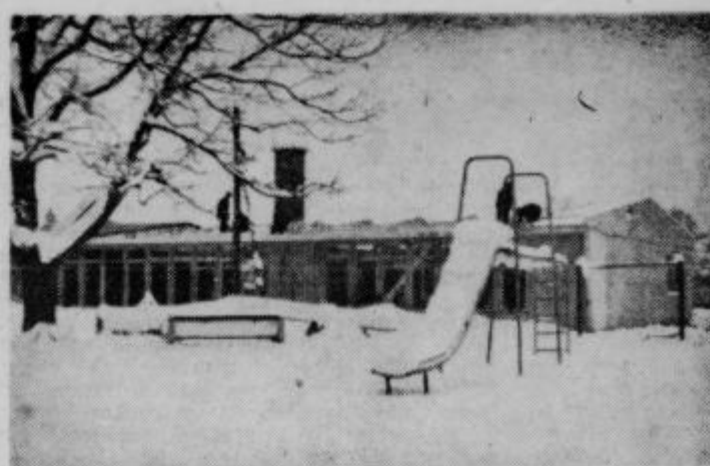
Montažna stavba Vrta Breg — Ptuj, ki so jo postavili delavci v hudem mrazu.