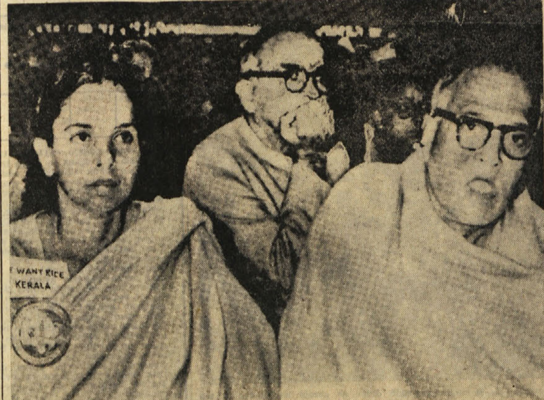
Med zasidanjem indijske kongresne stranke so delegati iz države Kerale privedli demonstracijo proti skrčenju obrokov rize. Zenska nosi napis: «Hočemo rizo»

Do sinoči so na sedežih RAI TV nabrali 850 milijonov lir za lačno prebivalstvo v Indiji; nabralno akcijo so sklenile podpirati tudi sindikalne organizacije CGIL, CISL in UIL, prosvetni minister pa je izdal ukaz, naj se zbiranje organizirano tudi na Indiji. Indijski predsednik Indira Gandhi je večkrat na kongresu kongresne stranke poudarila potrebo, da se bitka proti gladi in revščini vodi v vsej državi. Pomanjkanje hrane v septembru se predvideva tudi v mnogih krajih Pakistana. Ameriški predsednik Johnson je predlagal sklicanje mednarodne konference, na kateri bi razpravljali o koordinaciji ukrepov proti pomanjkanju v Indiji in povečanju gospodarske pomoči.