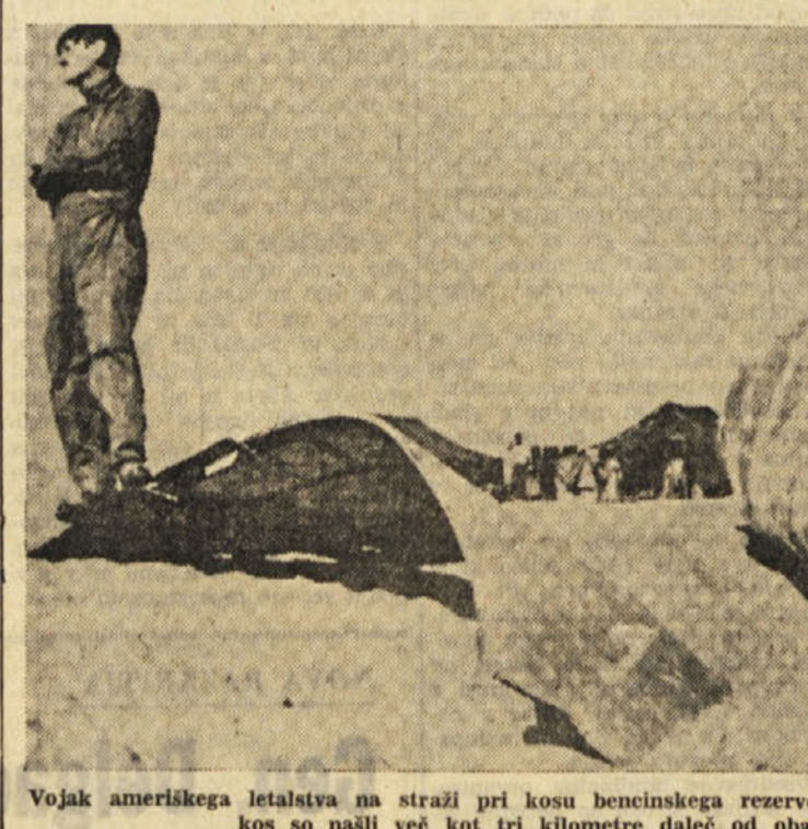
Vojak ameriškega letalstva na straži pri kosu bencinskega rezervoarja letala, ki je treščilo na tla. Ta kos so našli več kot tri kilometre daleč od obale pri Palomaresu

SIDNEY, 14. — V Avstraliji so uvedli nov denarni sistem. Namesto sterlinga, razdeljenega na šilinge in penice, je Avstralija uvedla dolar, razdeljen na stotinke.