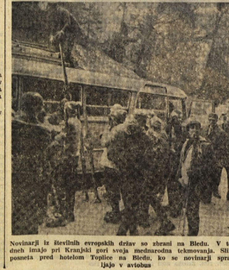
Novinarji iz številnih evropskih držav so zbrani na Bledu. V teh dneh imajo pri Kranjski gori svoja mednarodna tekmovanja. Silka poneseta pred hotelom Toplice na Bledu, ko se novinarji spravljajo v avtobus

SIDNEY, 14. — V Avstraliji so uvedli nov denarni sistem. Namesto sterlinga, razdeljenega na šilinge in penice, je Avstralija uvedla dolar, razdeljen na stotinke.