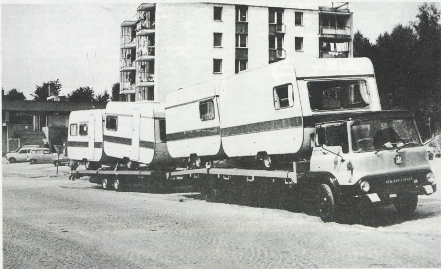
Del transporta vzorčnih prikolic za sezono 1981, namenjen na mednarodni sejem v Torinu. V IMV izdelamo na leto poprečno 300 – 500 vzorčnih prikolic.

časopis kolektiva industrije motornih vozil