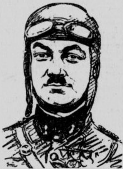
Francoški letalski poročnik Bonnet, ki je dosegel svetovni hitrostni rekord v letanju, je te dni pri letalskem tekmovanju v bližini Bordeauxa smrtno ponesrečil.

Neumayer je bil za časa večurnega zasliševanja — osumljenec je stal od torca popo-