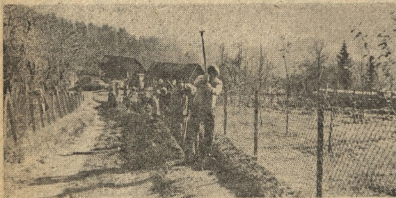
Tako je iz dneva v dan, vse dotlej, dokler ne bo prišla voda