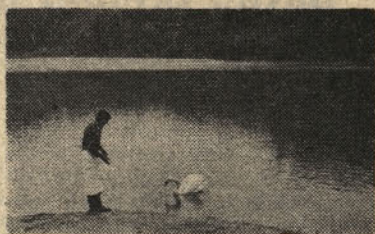
Idila ob Slivniškem jezeru

Očiščenega krapa od glave do repa po hrbtu plitvo zarezemo in nasolimo. Ocvremo 3—4 stroke česna. V kozico damo olje in ko je olje vroče, položimo vanj krapa na trebuh, kot da plava. Potresemo s precvrtim česnom. Ko se krap v pečici nekoliko zapeče, ga postopoma polivamo z 2 dl vina. Najokusnejši je pijani krap z džuvdžom.