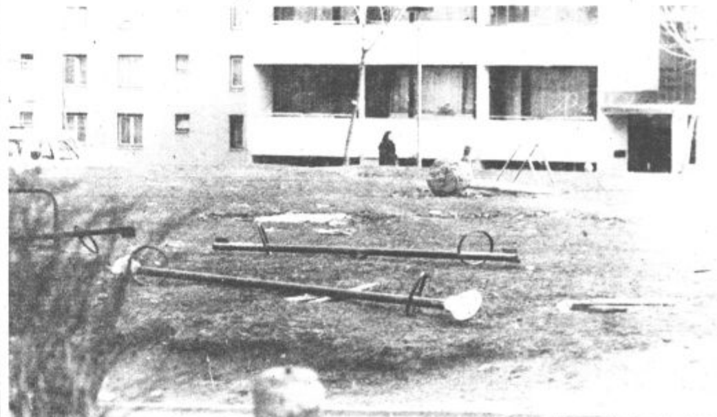
Pomlad je med nami. Resda se zima še ni povsem poslovila, pa vendarle upamo, da bo tudi sneg kmalu izginil. Tam, kjer ni več snega, pa se nam pomladansko okolje odkriva v vsej svoji lepoti. Ga bomo samo nemo opazovali, ali bomo kaj storili, da bodo gornji posnetki zelo redki?!