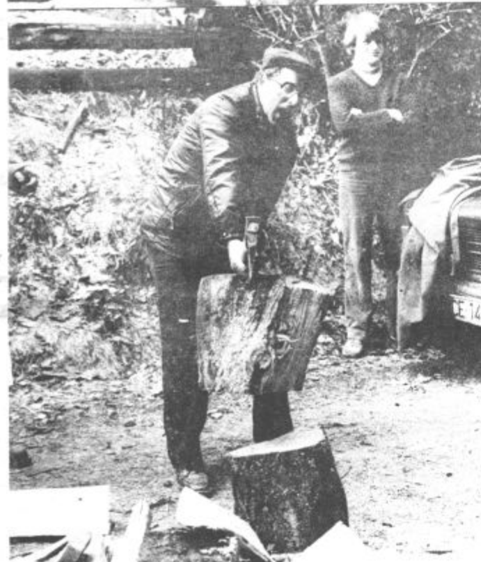
Bremena so težka, a smelo naprej