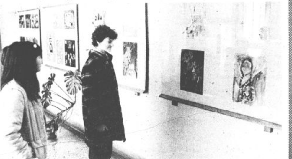
Na osnovni šoli Karla Destovnika Kajuha so v soboto odprli že 16. republiško razstavo likovni svet otrok. Tokrat so otroci razmišljali o tem, kakšno bo življenje v prihodnosti. Razstavljenih je 360 likovnih del iz 92 slovenskih osnovnih šol. Več o razstavi pišemo na 9. strani.