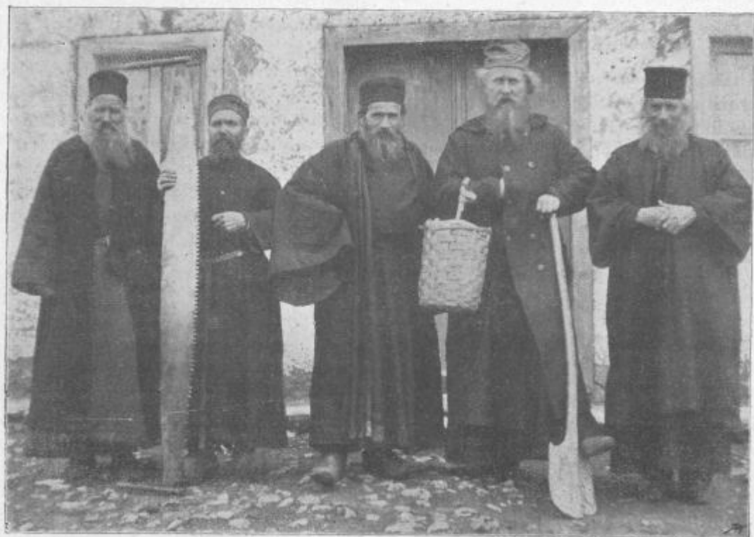
Mostrati. Sedanji misijonarji-menihi.

Prijatelji katoliških misijonov, častivci sv. Rešnjega Telesa, ali vas ne gane gorečnost mladega misijonarja? Pomagajte mu po svojih močeh. »Apostolstvo sv. Cirila in Metoda« je darovalo 150 K; treba je torej še 850 K. Pomagajmo, da cela Derviška Mogila postane katoliška in da med zanemarjenim ljudstvom zopet zavlada pravo krščansko življenje!