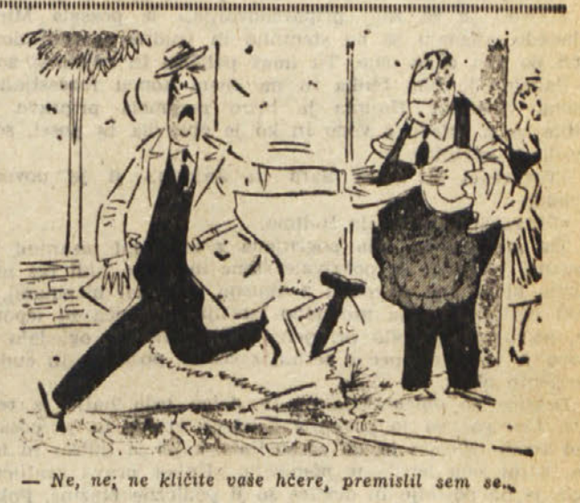
- Ne, ne; ne kličite vaše hčere, premislil sem se.

Skušali smo ustvariti med našimi poslušalci in izvajalci tisto pravo vdušje, ki je potrebno, da se literarni večer spreminja v literarno majo. Veselje pripravljamo za nastopajoče, ki bodo prvič pred svojimi bralci, vesenje za poslušalce same, ki bodo prvič imeli pred seboj tiste avtorje, katerih imena in dela so opazili na straneh revije same. Tako so načrti, kako se bodo ureničili, pa nam bo pokazal jutrišnji nastop.