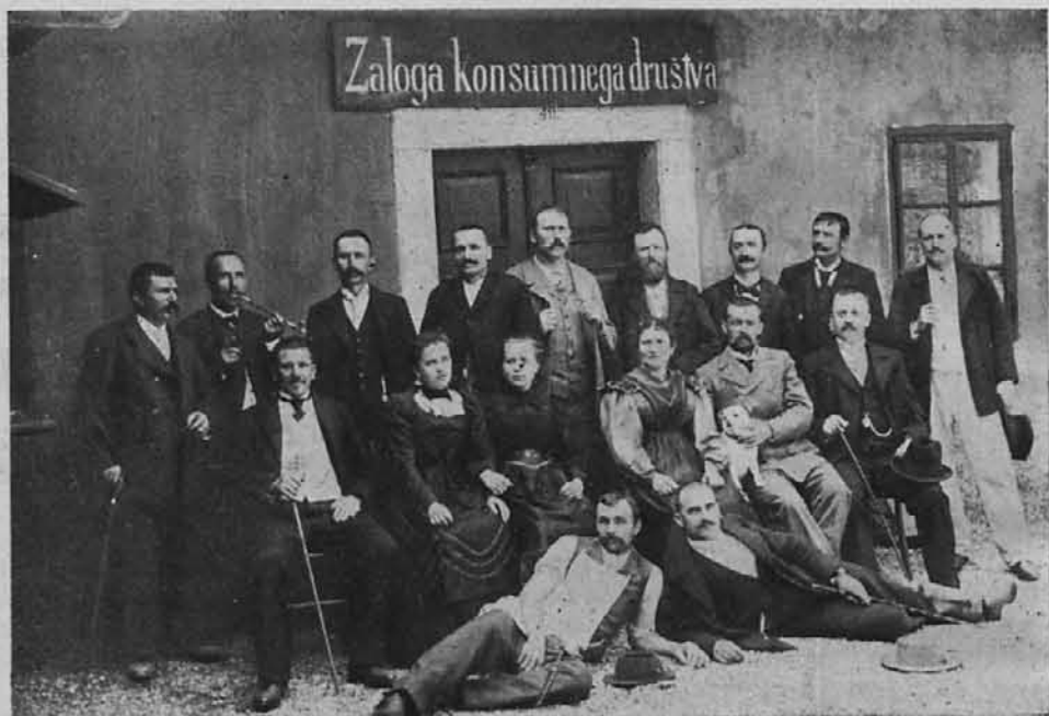
Prvi odbor I. delavskega konzumnega društva na Jesenicah leta 1898.

privatno trgovino k temu pripeljali. Dobra stran zadrug je ta, da so one tako rekoč regulatorji cen življenjskim potrebščinam. To se je občutilo posebno med svetovno vojno in prvo dobo po vojni. Ker je ravno govor o časih, ko so ljudje občutili vso mizerijo življenja, je prav, da se malo pomudimo pri tisti dobi. Se so žive matere in gospodinje, ki se živo spominjajo, kaj pomeni, ko je shramba prazna in ni niti za denar mo-