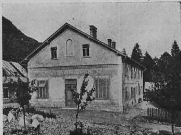
Stanovanjska hiša IDKD.