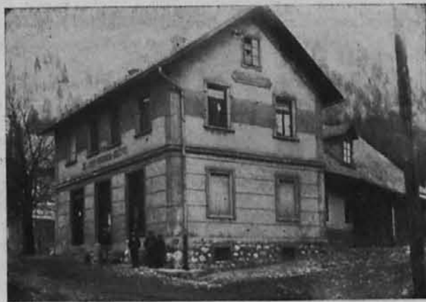
I. delavsko konzumno društvo Jesenice 1911.

Marsikateri stavi pri teh vrsticah pripombo: »saj mi privatni trgovci nudijo isto.« Res je, da nudijo oni tudi procenke, da imajo malo da ne iste cene kakor konzum. Toda vedeti je treba, da jih nekoč niso nudili in tudi sedaj jih ne bi, ako bi ne bilo zadrug. Konzumi so tisti, ki so