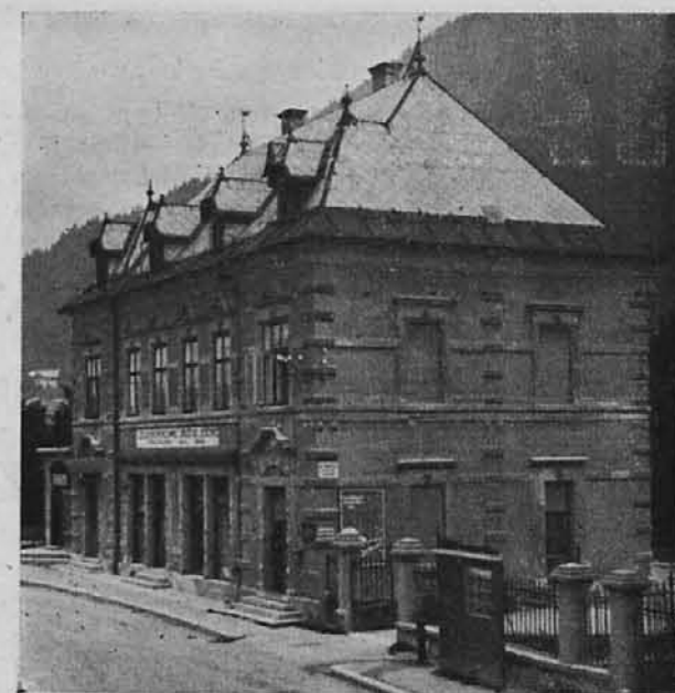
Podružnica prodajalne na Savi. Poslopje IDKD Jesenice.