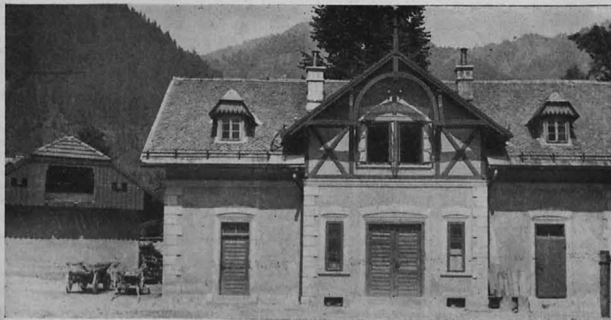
Gospodarsko poslopje in skladišče IDKD.

rov se je ta gnus poročil in prav zaradi tega se čudimo, kako je mogoče, da je