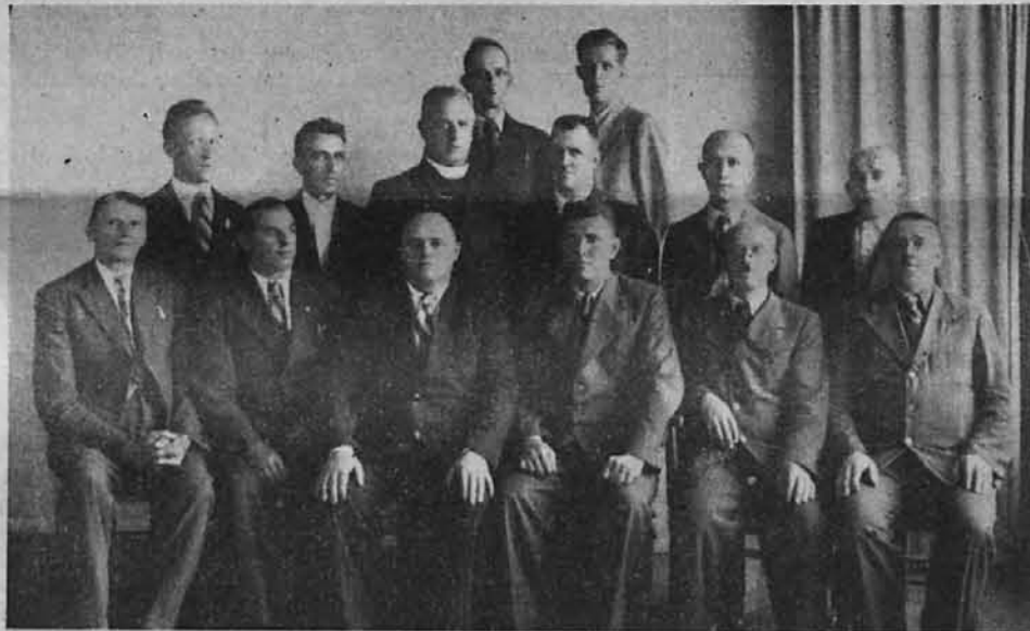
Sedanji člani načelstva in nadzorstva IDKD.