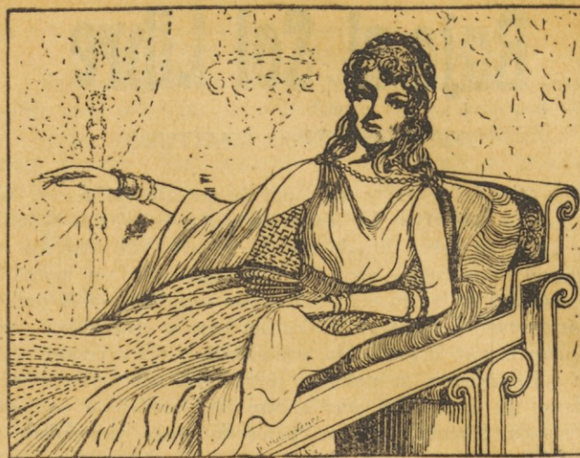
Alanka levantó la mano . . . .

Pero Iztok deseaba emprender la marcha. Estaba seguro de no encontrar en ninguna parte resistencia huno. Estaba orgulloso de haber vencido a los hunos, magníficos guerreros, aunque le hubieran en parte diezmado su caballería. Pero esta falta pudo llenarla con los caballos hunos y con los jovencitos, que de buena gana vistieron las corazas