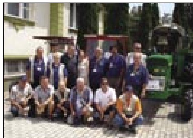
Ljubitelji starih traktorjev z generalnim konzulom in njegovo soprogo

Kak je pravo generalni konzul mag. Drago Šiftar že pred enim letom, gda je prišo v Monošter, ščē, ka bi vrata konzulata bila oprejta pred vsakšim. Tau se zdaj vse bole uresničüvle. General-