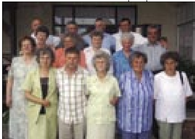
Nekdanji števanovski šaularge, steri so šaulo skončali pred 50. lejtami