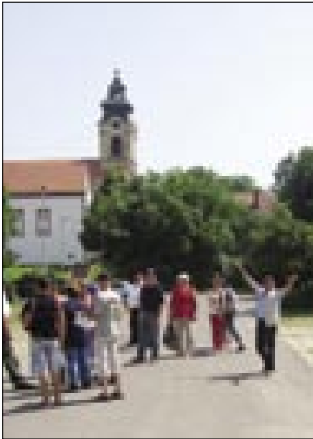
Ključarovčani so si ogledali tudi monoštrsko baročno cerkev