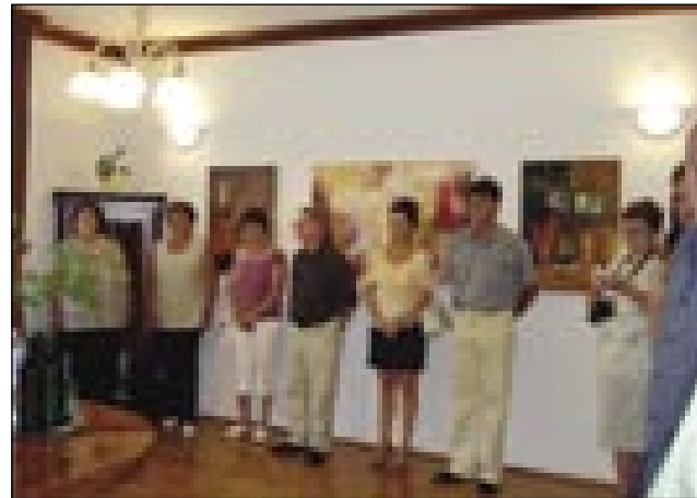
Otvoritev razstave na generalnem konzulatu

Slovenski generalni konzulat v Monoštri je grato v zadnjom časi eden od tisti punktov v našom varaši, stere radi gorziščeje Slovenci iz Slovenije, Slovenci iz Porabja pa Madžari iz Varaša.