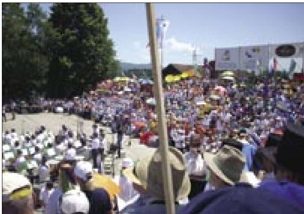
Na letošnjom Tabori je spejvalo kakšni 4500 lidi

Slavnostni govornik na letošnjom srečanji je bijo predsednik vlade (kormány) Janez Janša , steri je gučo o trej obletnicaj. Najprva o tom, da se v tom kraji na Dolenj-