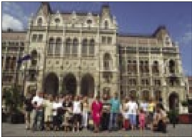
Andovčani z gostitelji pred Parlamentom

Slovensko društvo v Budimpešti vsakšno leto 21. junija ma piknik s kulturnim programom.