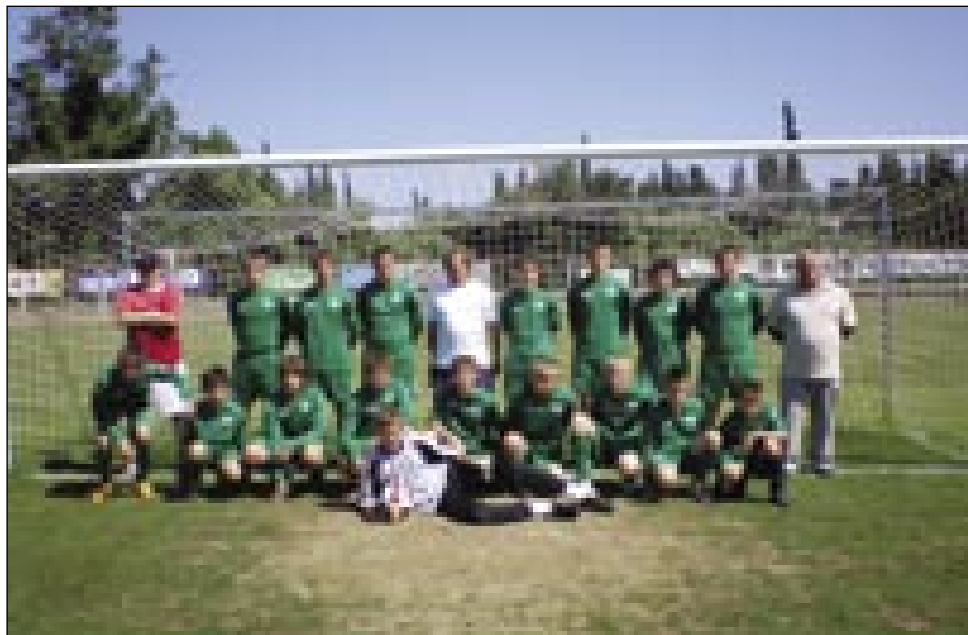
Mladi nogometaši NK Slovenska ves

ši futbalisti. Pa je tak bilau. Brsnili so dva, dobili so pa en gol, steroga bi njim spoj nej trbelo, depa ka do, če je kon-