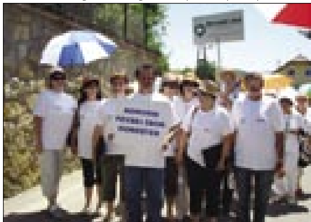
Komorni pevski zbor ZS na povorki

Marijana Sukič