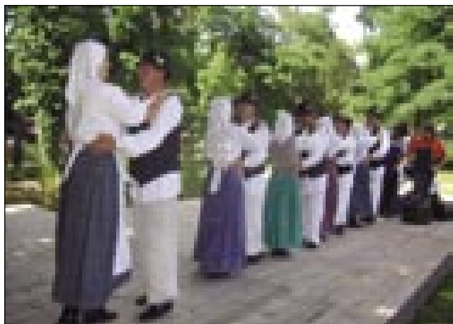
Folklorna skupina iz Babinec

se napautili. Sami s sebov smo vözdelali, zato ka smo se samo gnauk leko stavili na pet minut, ovak bi nej prišli scajntoma. Dapa tau je nej bila taša velka