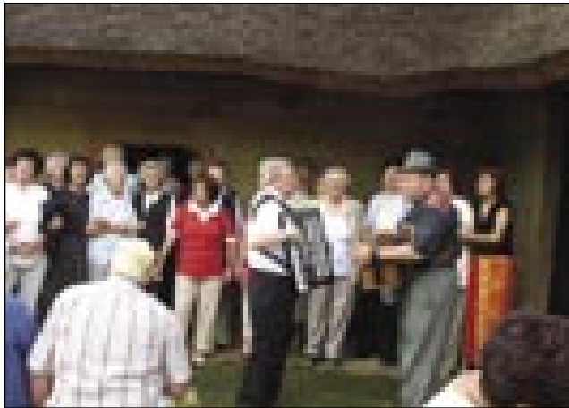
»Mešani« porabski pevski zbor

Tak bi leko malo prejkspisali poznano porabsko nauto. Če je človek malo najgir pa ma volau, leko na Ivanovo nauč dosta muzejev pogledne. Tau nauč, štera je najkračiča v leti, so skoro vsi muzeji na Vogrskom do zranka oprejeti pa s vsefele programi lüstvo čakajo. Prvo muzejsko nauč so organizerali pred petimi lejtami, letos pa se je že več kak dvejstau gezero lüdi odlaučilo, ka tau zacumprano nauč v muzejaj preživé.