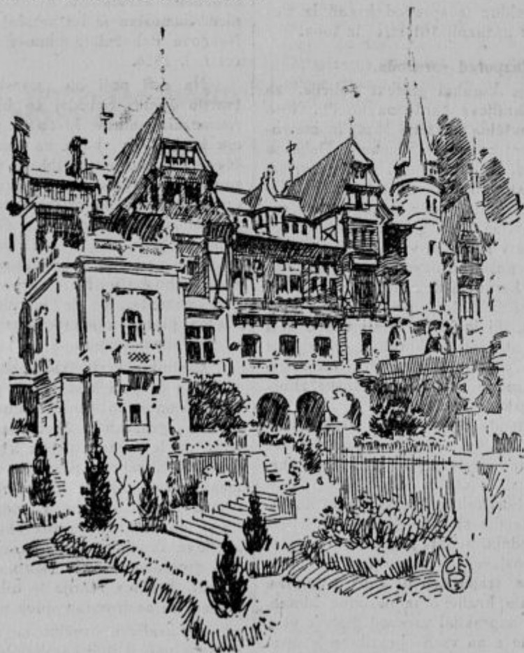
Grad Peles v Romuniji, kjer je umrl kralj Ferdinand.

v Pariz, 25. julija. (Izv.) Proti vsem vestem o princu Karolu se zatrjuje, da je princ še vedno v Parizu. Nahaja se še vedno v svoji privatni vili v Neulliyu, kjer živi popolnoma zase in ne sprejema nikakih obiskov. Zatem, ko je bila pri njem včeraj popoldne delegacija iz Bukarešte, še ni sprejel nikogar. Iz njegove okolice prihajajo poročila, da dobiva princ številne izraze simpatij od članov romunskih inozemskih kolonij, kjer ga povsod nazivajo kot romunskega kralja.