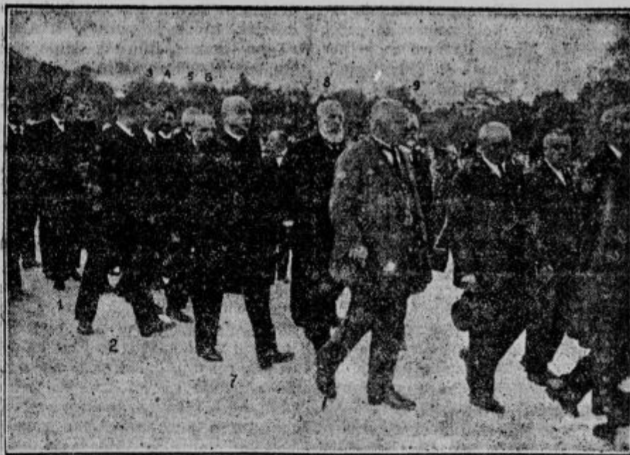
Zastopniki avstrijske vlade pri pogrebu policijskih stražnikov, padlih ob zadnji revoluciji.

v Newyork, 25. julija. (Izv.) Saccho in Nanzeki sta pred devetimi dnevi stopila v gladovno stavko. Saccho še vedno odklanja vsako hrano, Nanzetti pa je v nedeljo s stavko prenehal.