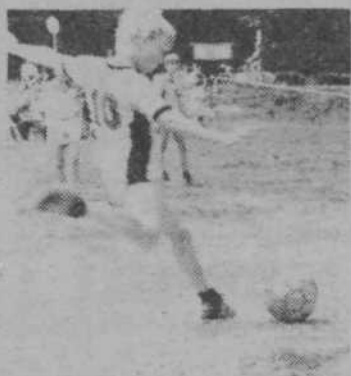
Takile prvi nogometni koraki pa najbrž niso zadnji.